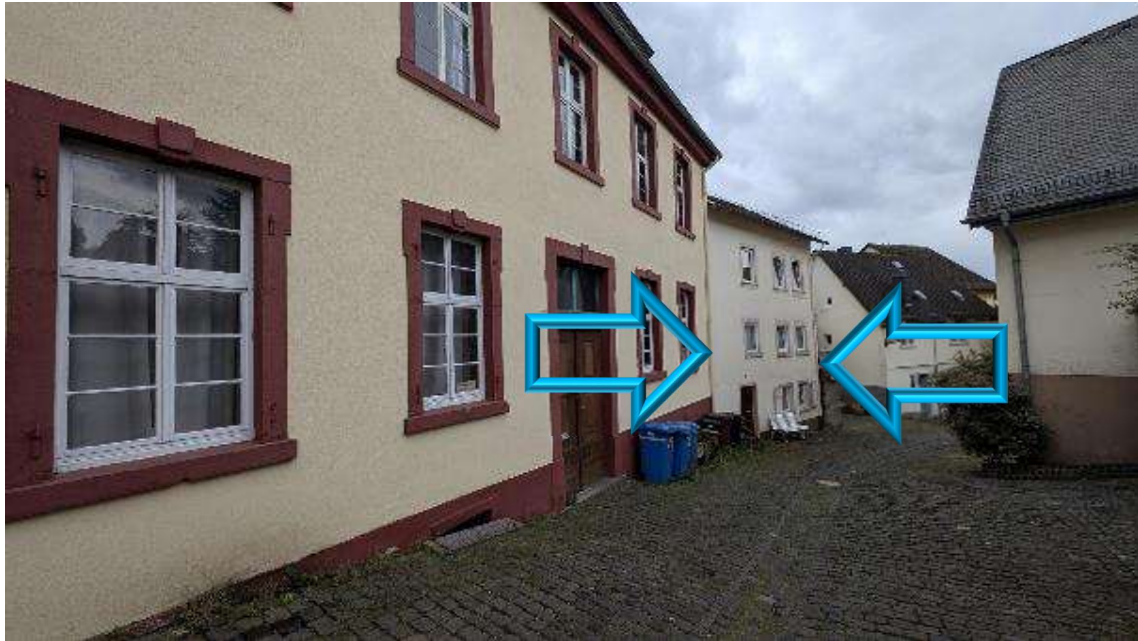
Bild B1 Straßenansicht