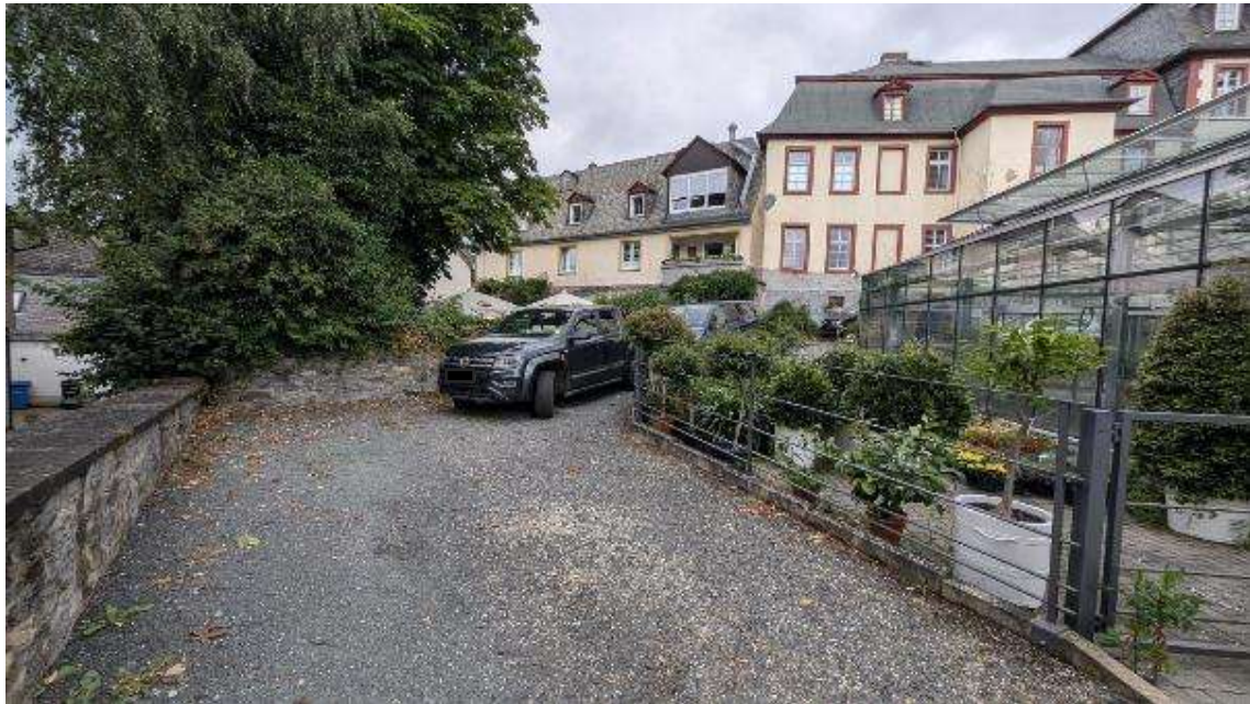
Bild B3 Rückansicht