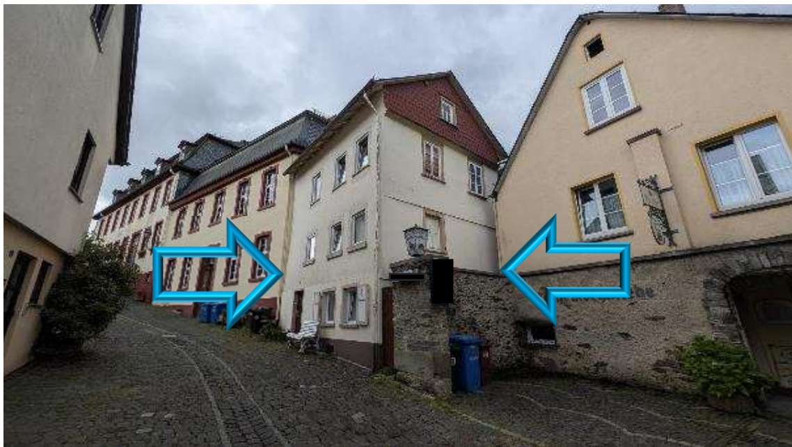
Bild B2 Straßenansicht