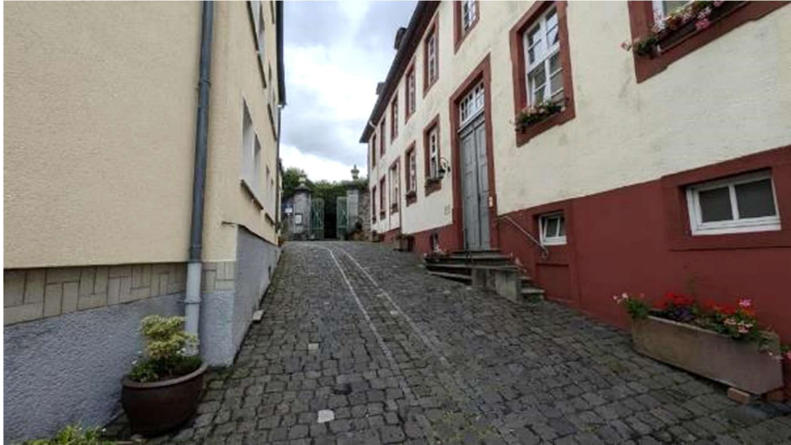
Bild A1 Blick in die Erschließungsstraße