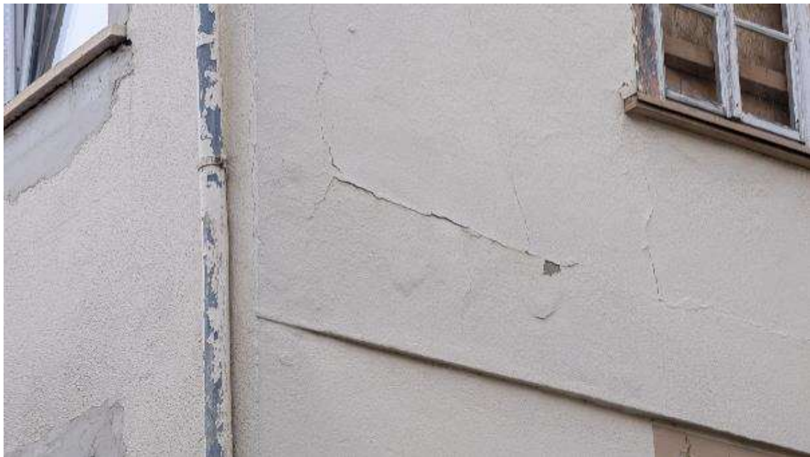
Bild C3 Unterhaltungsbesonderheiten