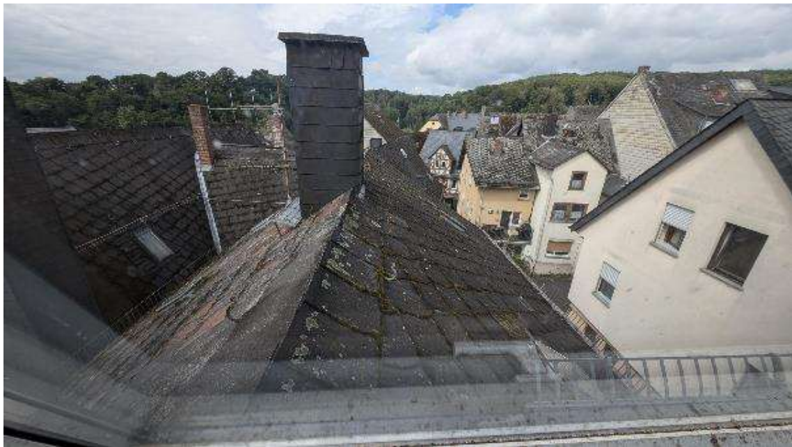
Bild B4 Dachansicht