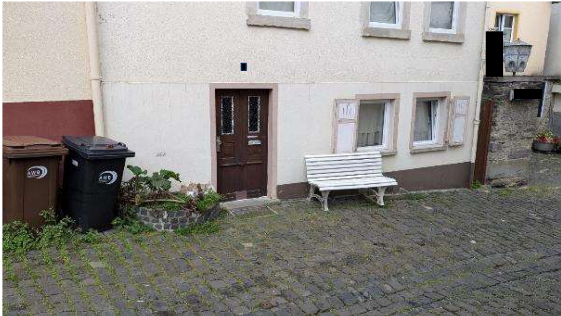
Bild B5 Gebäudeeingang