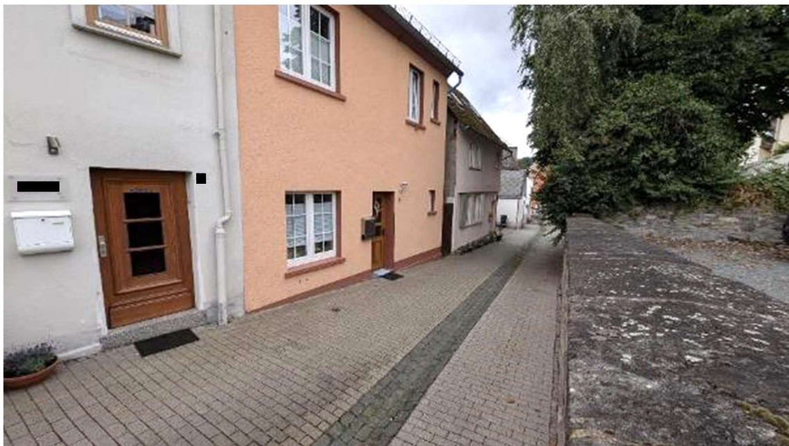
Bild A2 Blick in die Erschließungsstraße