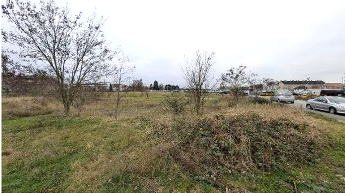
Bild B1 exemplarische Grundstücksansicht