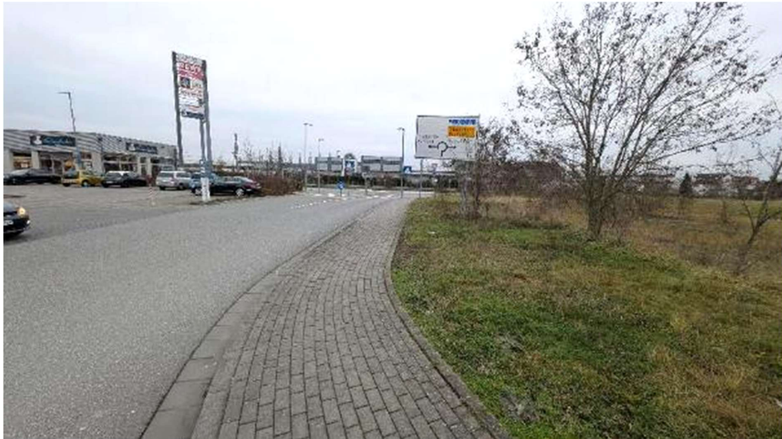
Bild A2 Erschließungssituation / Umfeld