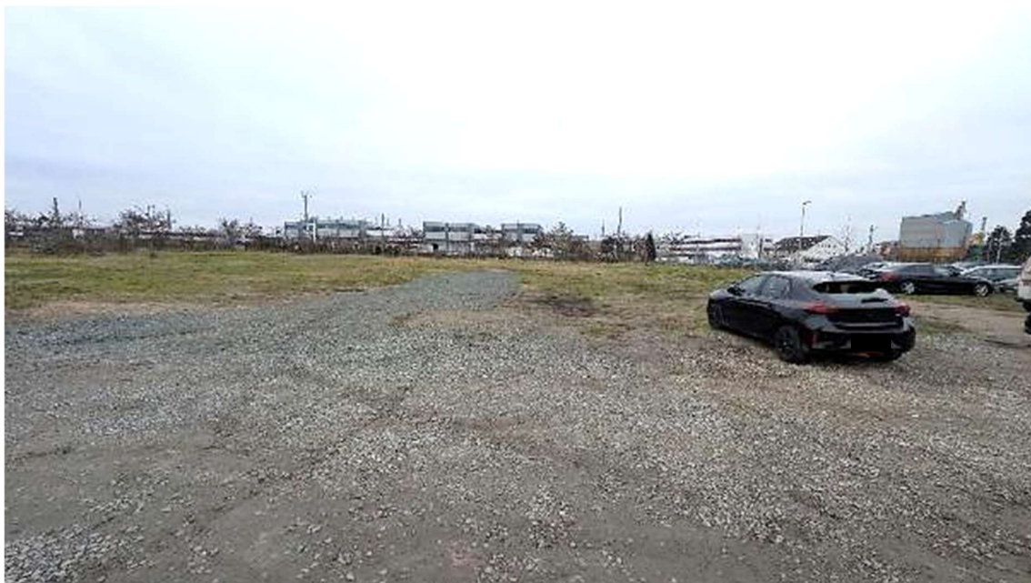
Bild B6 exemplarische Grundstücksansicht