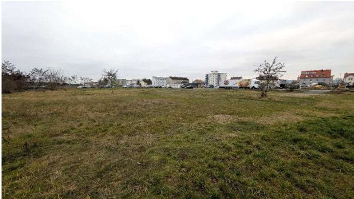
Bild B2 exemplarische Grundstücksansicht