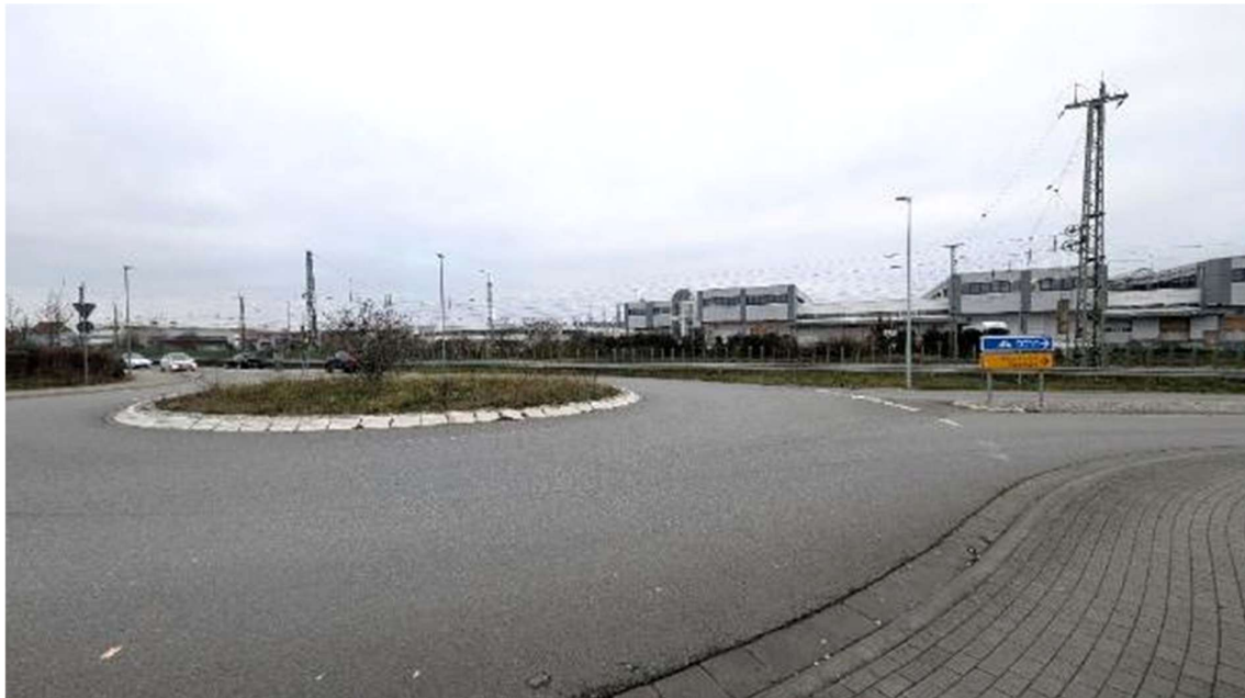
Bild A1 Erschließungssituation / Umfeld