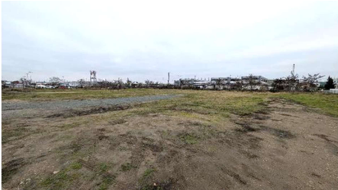
Bild B5 exemplarische Grundstücksansicht