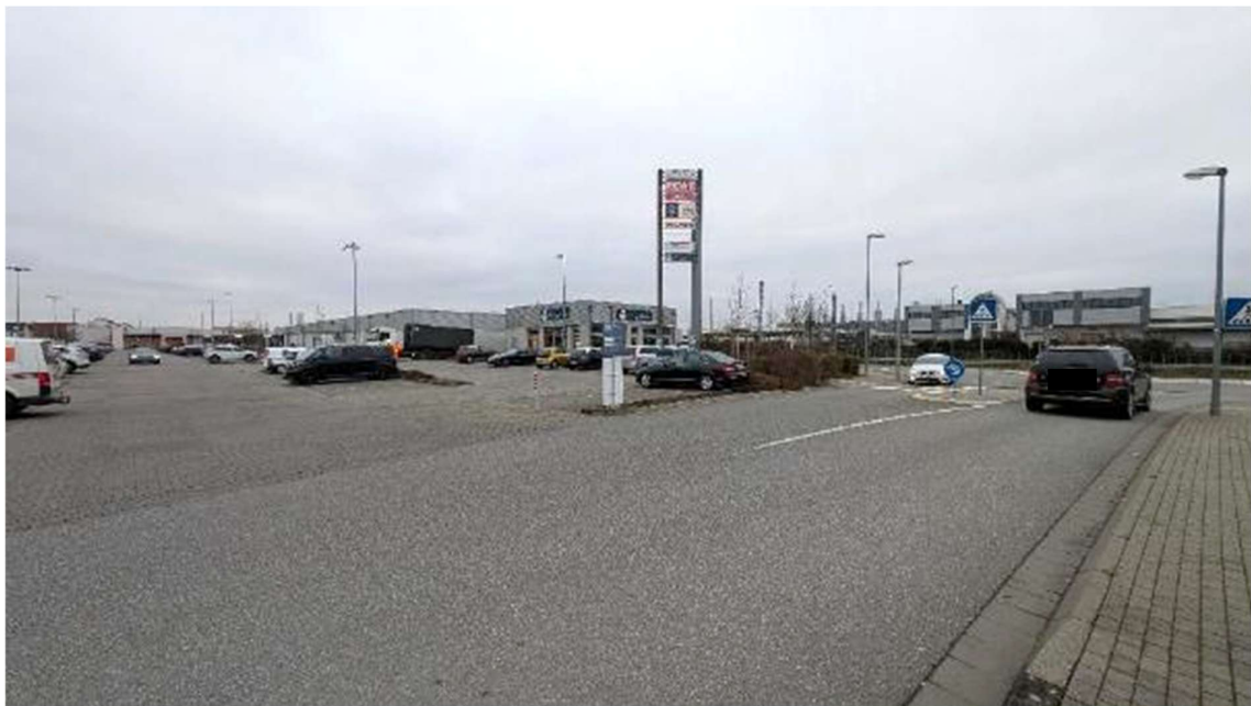
Bild A3 Erschließungssituation / Umfeld