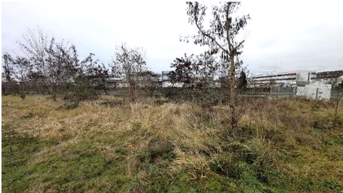
Bild B4 exemplarische Grundstücksansicht