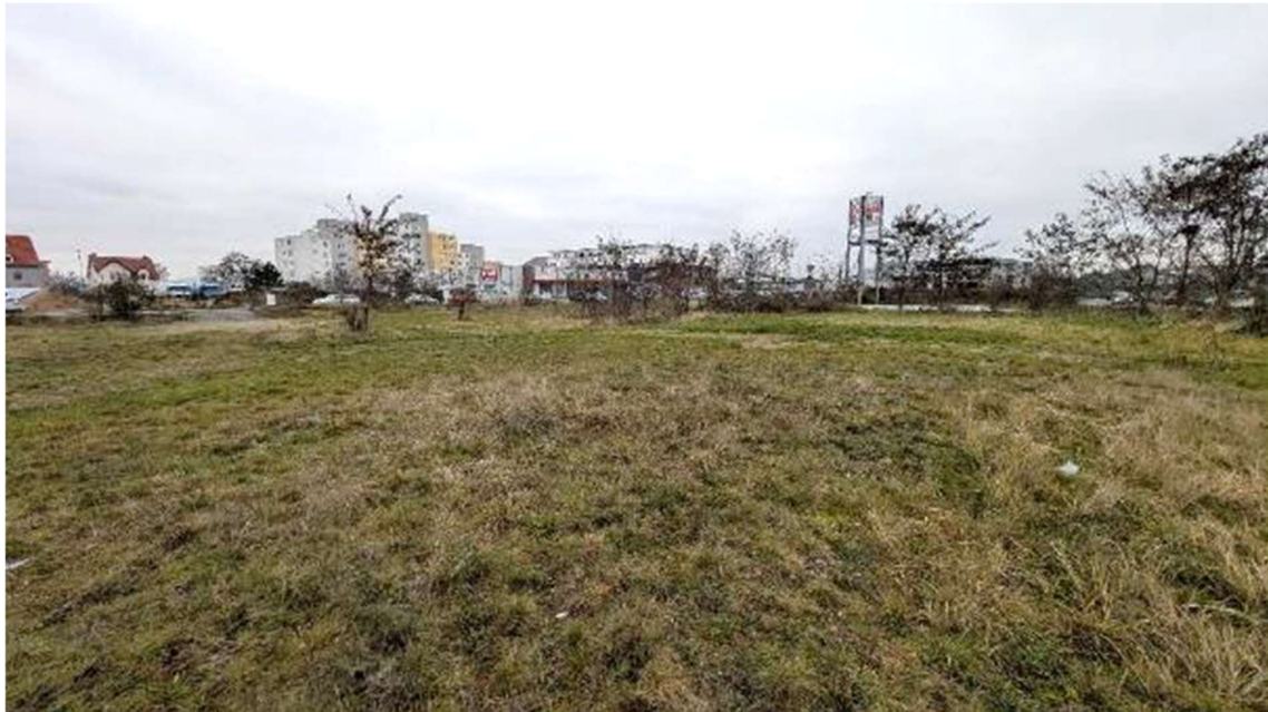
Bild B3 exemplarische Grundstücksansicht