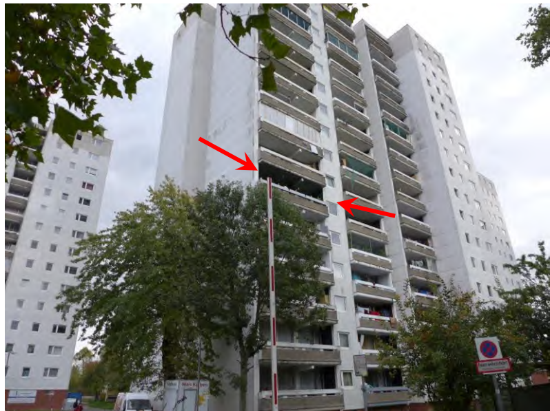
Westansicht Rohrbrunner Weg 2-4, Lage des Objekts

Baubeschreibung: Es handelt sich bei dem Bewertungsobjekt um eine 3-Zimmerwohnung mit Küche, Bad, Loggia, Flur, in einem 17-geschossigen Mehrfamilienwohnhochhaus (Bj. 1972/73) als Teil einer Großblockwohnanlage am Ortskernrand von Dietzenbach. Der bauliche Zustand ist dem Baujahr und Objekt entsprechend mäßig. Es handelt sich um eine problematische Gesamtanlage. Es besteht ein genereller Sanierungs- und Modernisierungsbedarf am Gebäude. Die besichtigten Bereiche waren baujahresentsprechend instandgehalten und gepflegt. Das Bewertungsobjekt (Wohnungserbbaurecht Nr. 422) liegt im 6. Obergeschoss des Hauses Rohrbrunner Weg 2-4. Eine Allgemeinbeurteilung ist wegen fehlender Innenbesichtigung nicht möglich. Üblicherweise sind die Wohnungen in der Anlage baujahresentsprechend einfach ausgestattet. Es wird von normal gepflegten Räumlichkeiten und tlw. vorgenommenen Modernisierungen ausgegangen. Es wird von einem unterdurchschnittlichen Gesamtzustand ausgegangen.