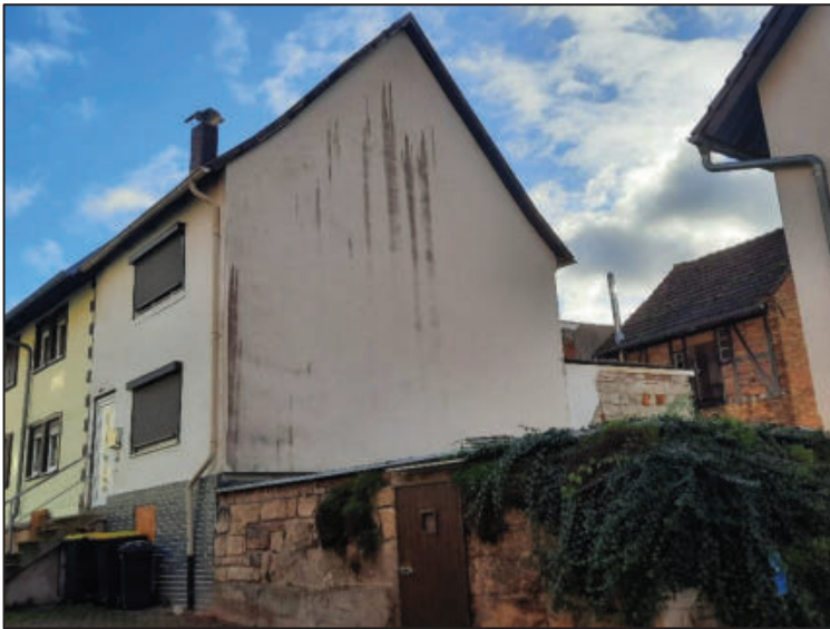
Abb. 5: Abb. 4: Straßenansicht und Giebelseite; Nebengebäude im Hintergrund