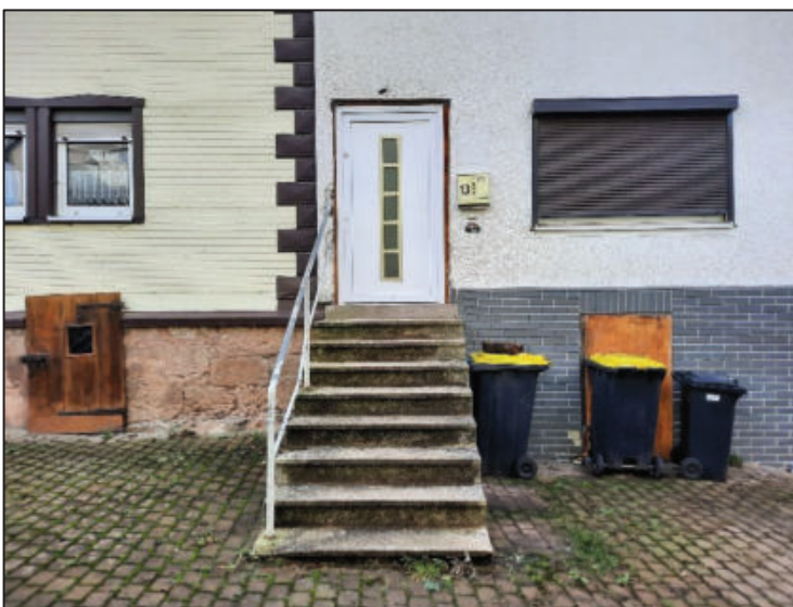
Abb. 3: Hauseingang