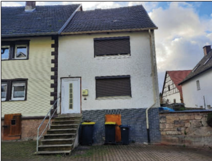
Abb. 2: Straßenansicht