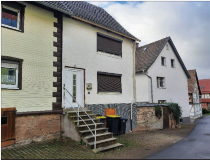
Abb. 1: Straßenansicht