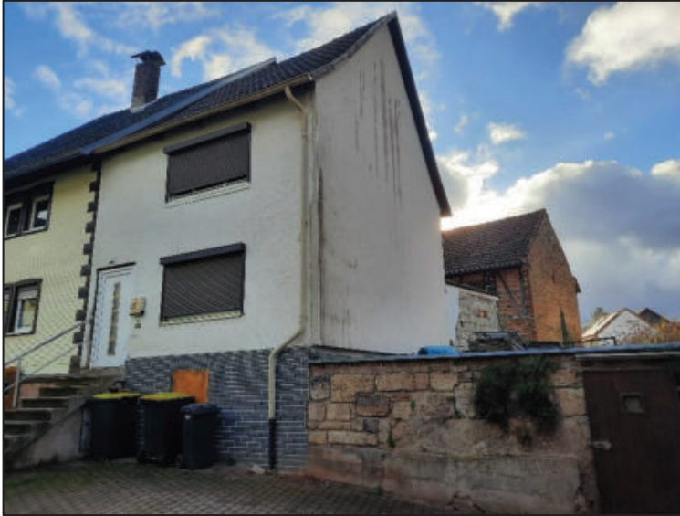
Abb. 4: Straßenansicht und Giebelseite; Nebengebäude im Hintergrund