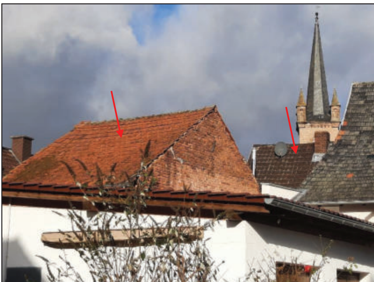
Abb. 6: Rückansicht Nebengebäude und Dach Hauptgebäude