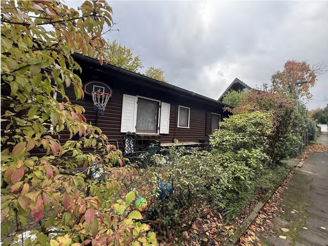
Ansicht des Bewertungsgrundstücks vom Erschließungsweg betrachtet