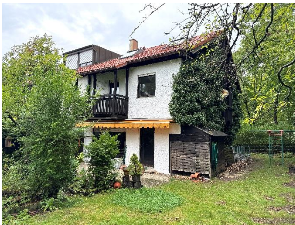
Ansicht von Südosten

Amtsgericht München, Az.: 1514 K 98/25 · Projekt 25.G.08