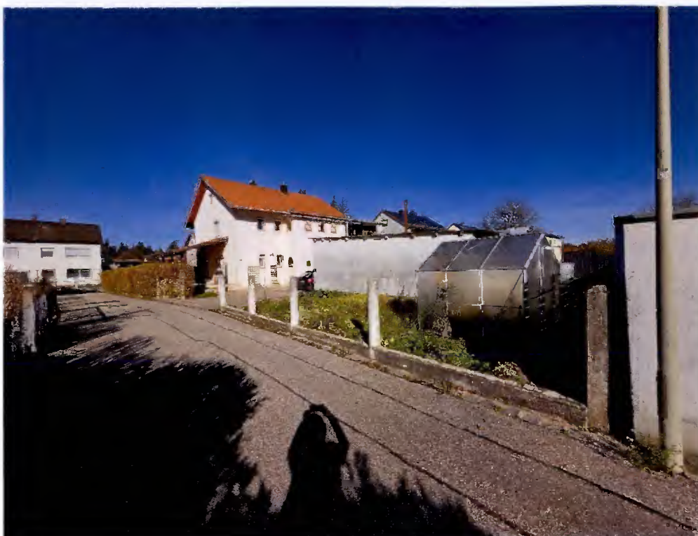
Wohnhaus: Süd- und Westseite; Garage: Westseite; Gewächshaus