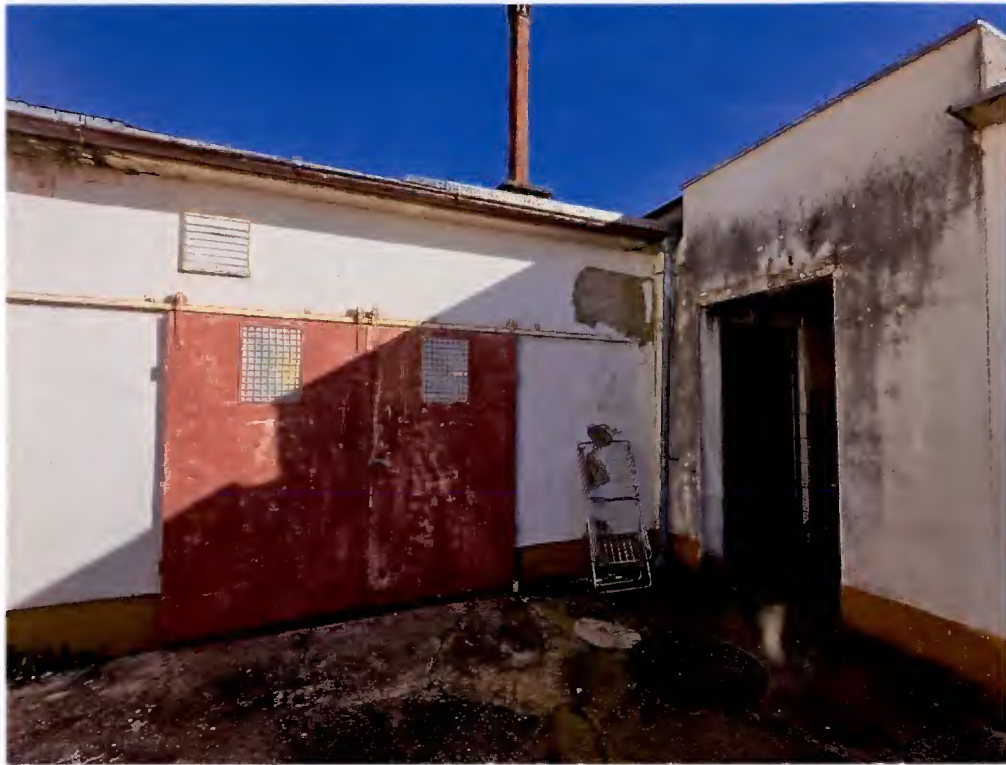
Teilansicht Fassade von Westen und Norden