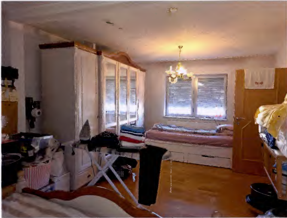
Elternschlafzimmer, Teilansicht Richtung Norden