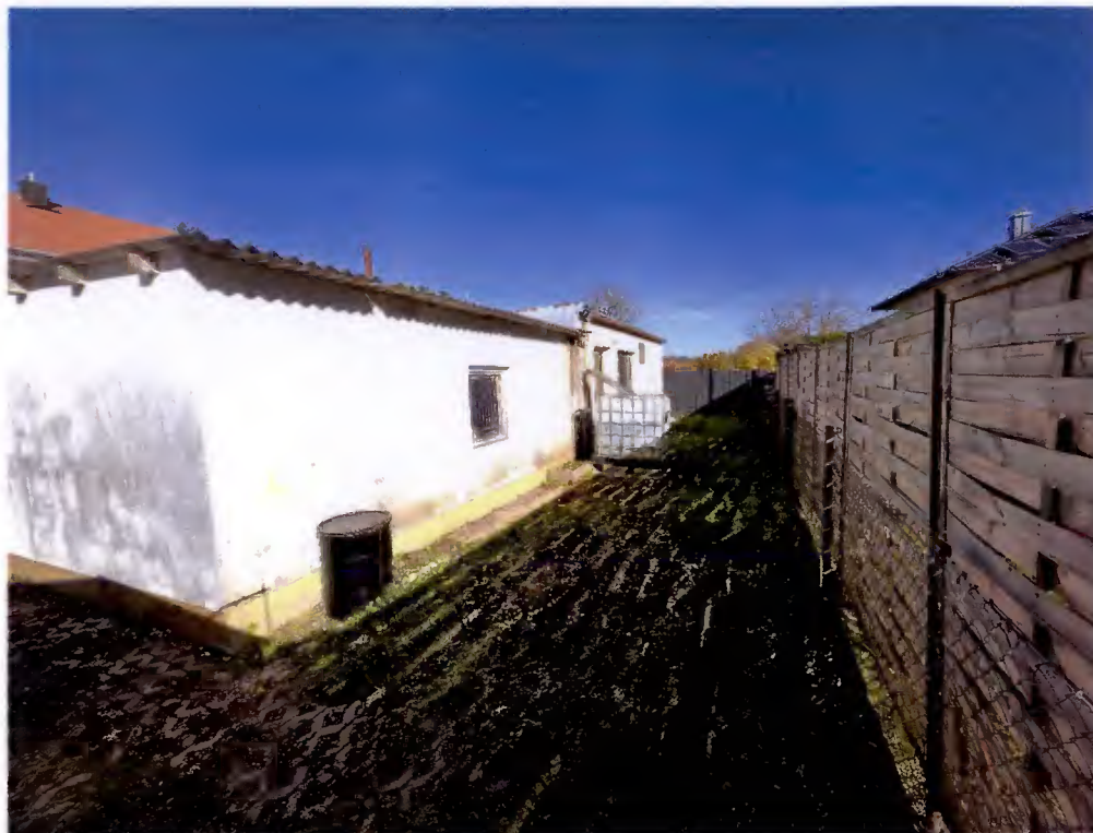
Westseite, Teilansicht und Südseite