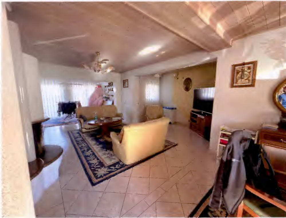
Wohnzimmer mit Wintergarten (auf der Nordseite) und Erweiterung in die ehemalige Metzgerei