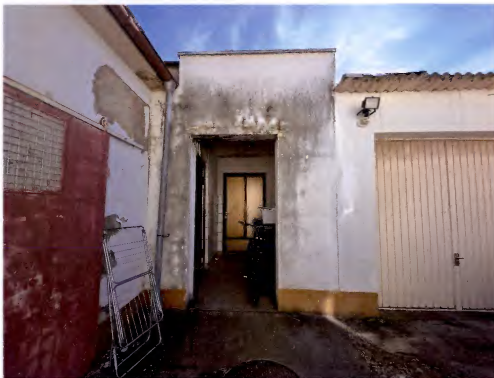
Eingangsbereich Richtung „Geräteraum“