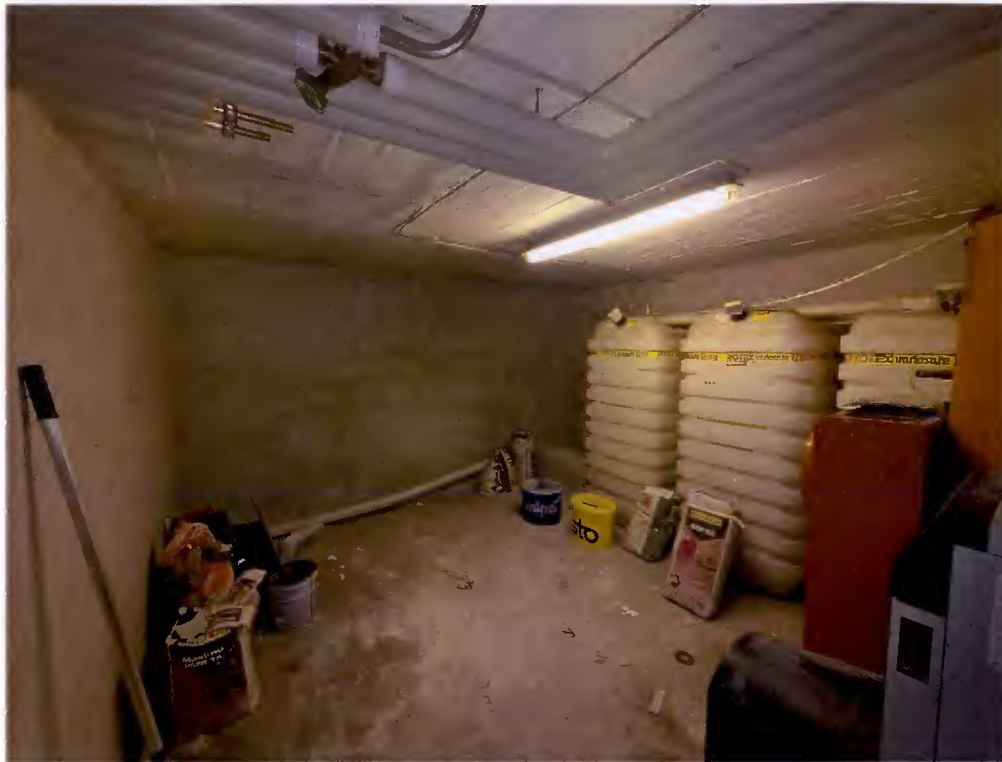
Heiz- und Tankraum