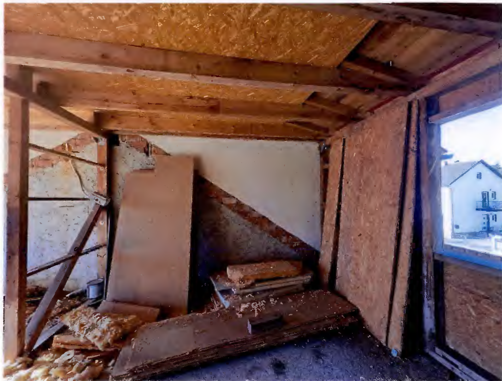
Innenansicht, geplantes Zimmer „Kind 3“