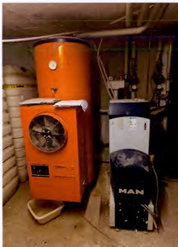
Heizung und Warmwasserboiler