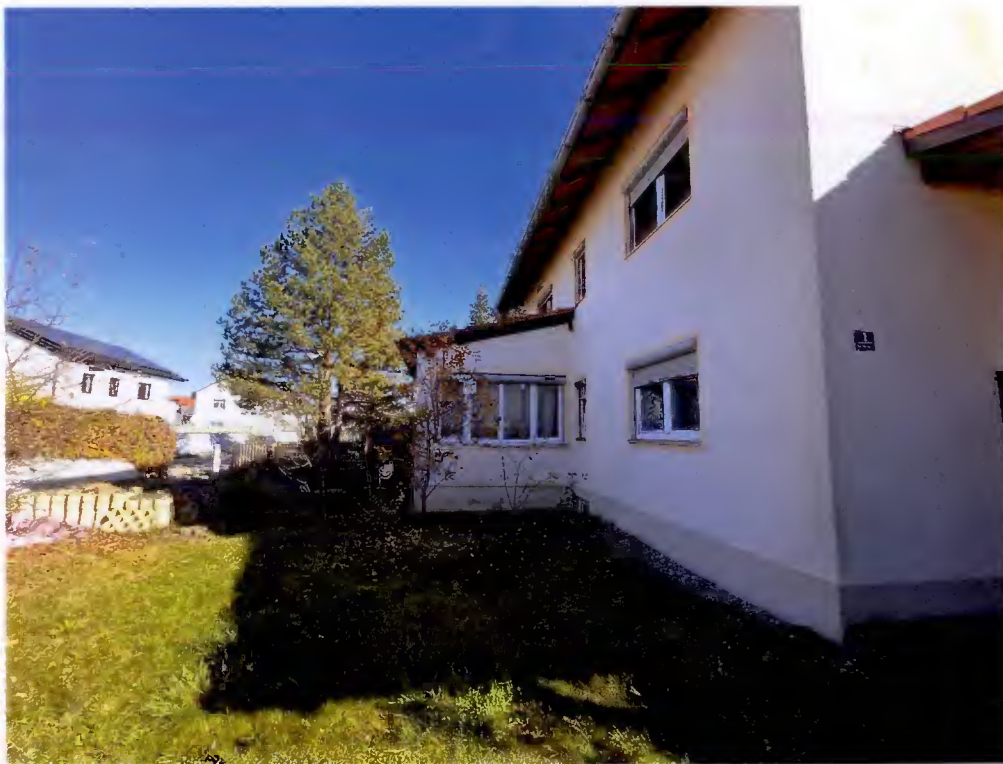
West- und Nordseite