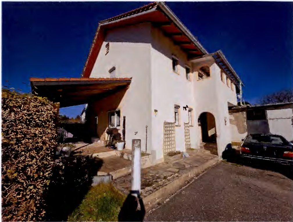
Wohnhaus: Süd- und Westseite