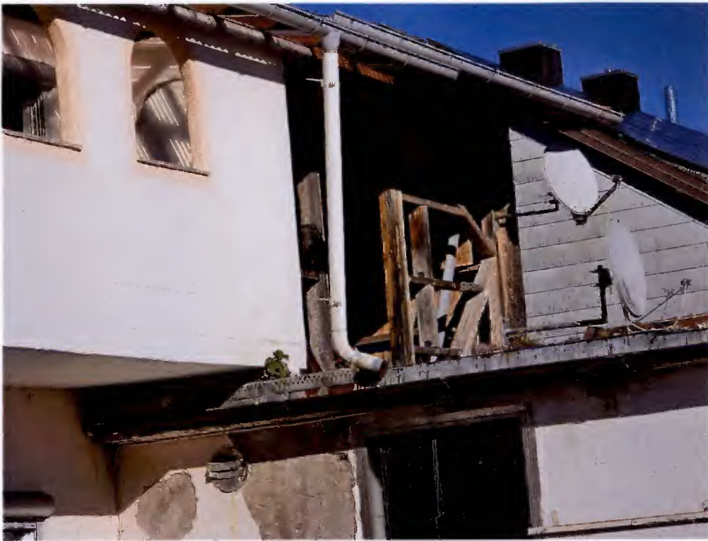
unfertiger, aufgeständerter Anbau über der ehemaligen Metzgerei