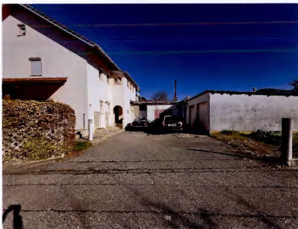
Einfahrtsbereich, Wohnhaus, ehemalige Metzgerei und Doppelgarage