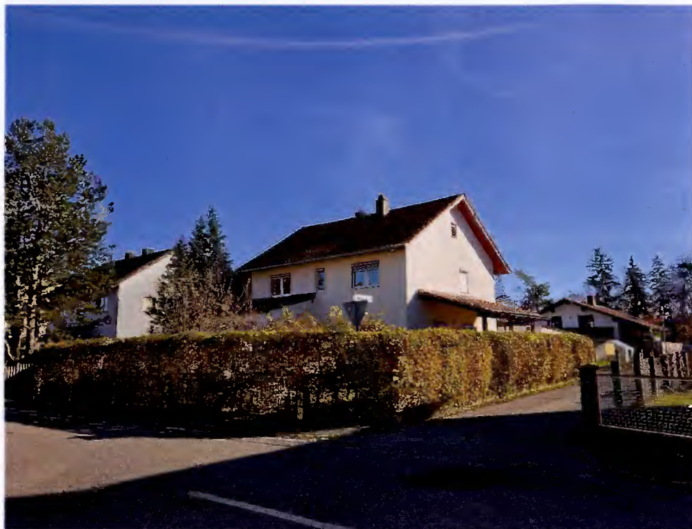
Nord- und Westseite