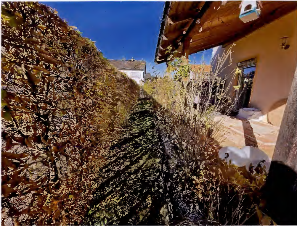
überdachter Freisitz und Westseite vom Garten