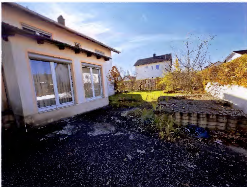
Nordseite, Wintergarten Detailansicht