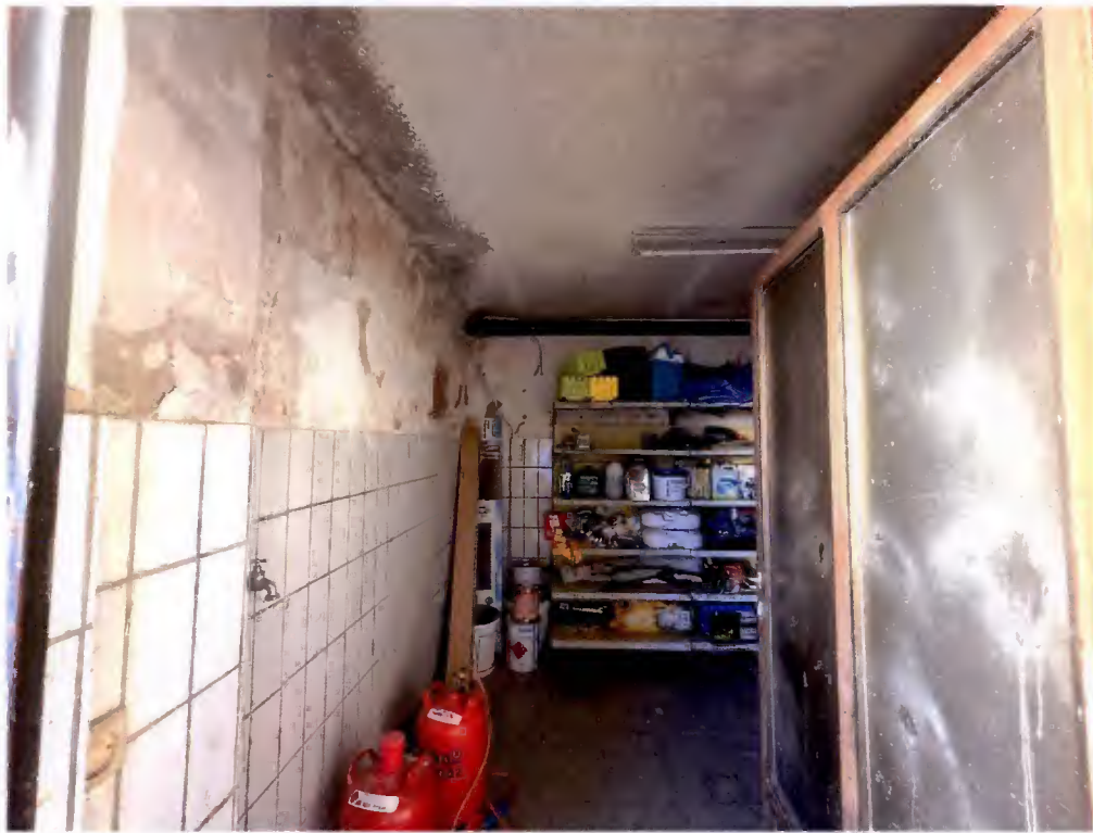
„Metzgerei, Gewürze und Zubehör“