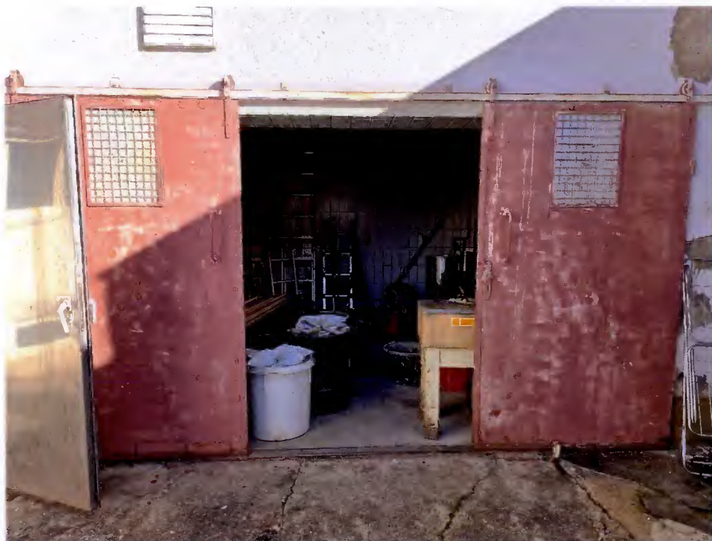
Raum „Vorbereitung“ mit Räucherkammern