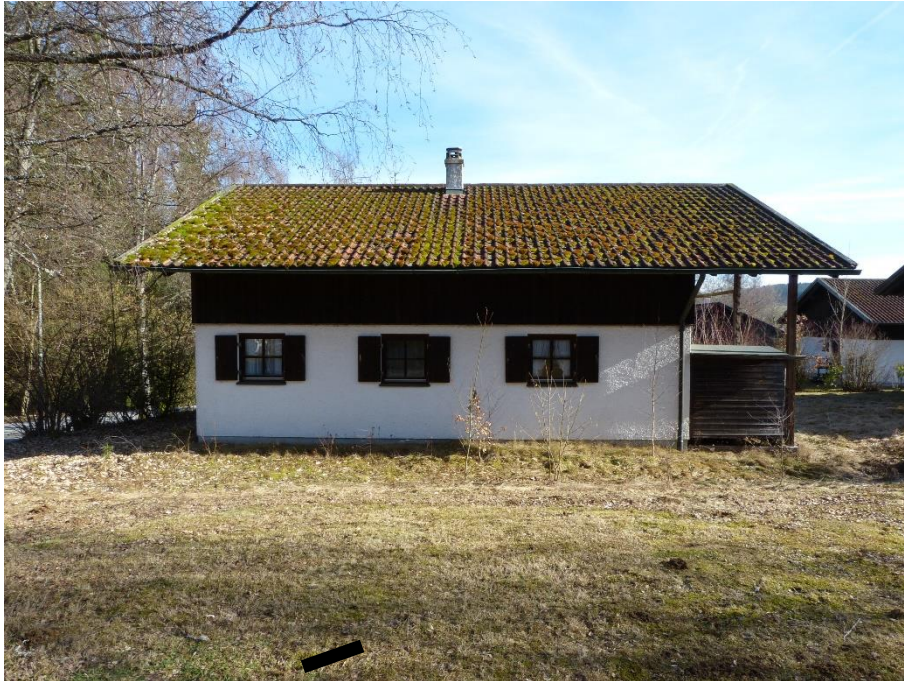
Ferienhaus, Ansicht von Westen