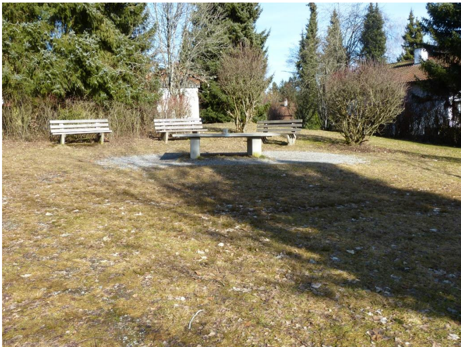
Aufenthaltsfläche, Flur Nr. 256/46