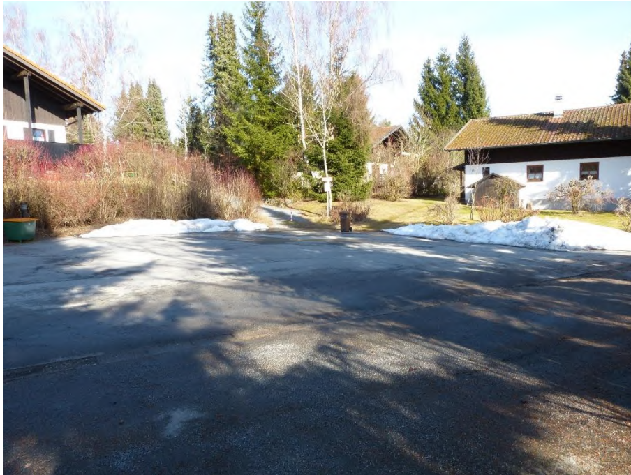
Wendeplatz, Flur Nr. 256/74