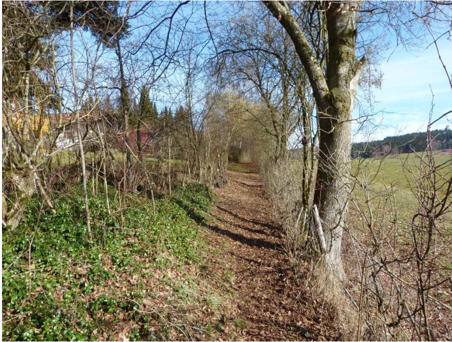
Fußweg, Flur Nr. 256/36