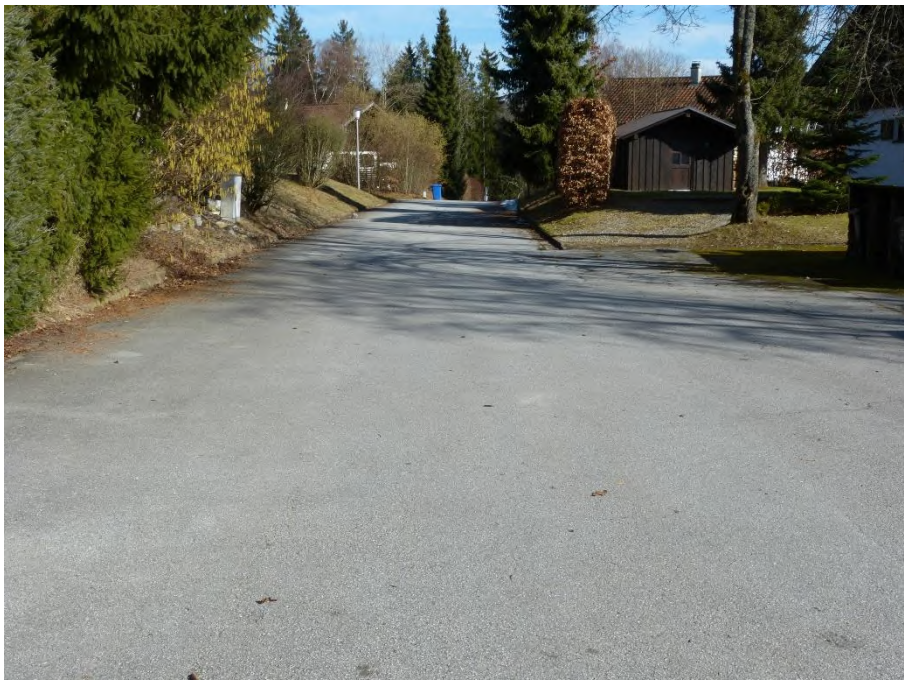
Verkehrsfläche, Flur Nr. 256/27