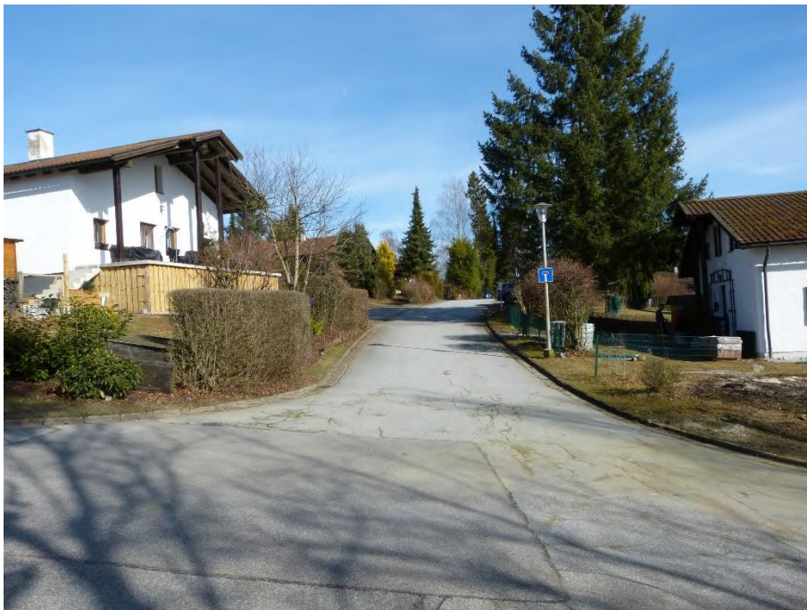
Verkehrsfläche, Flur Nr. 256/74