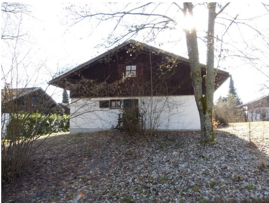
Ferienhaus, Ansicht von Norden