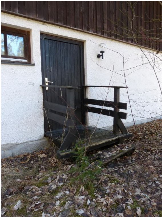
Ferienhaus, Teilansicht Hauseingang