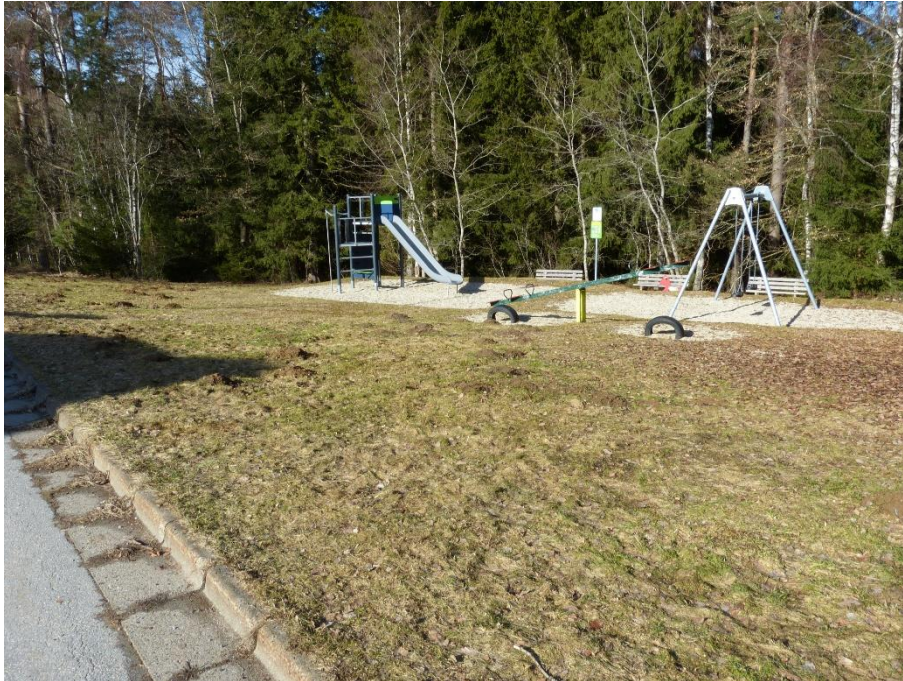
Kinderspielplatz, Flur Nr. 256/101