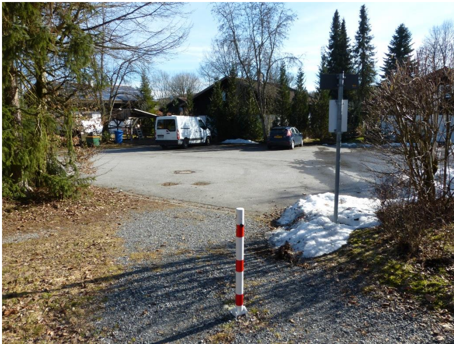
Wendeplatz, Flur Nr. 256/27