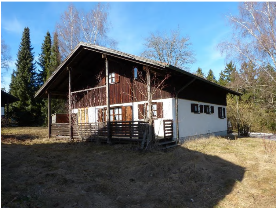
Ferienhaus, Ansicht von Südosten