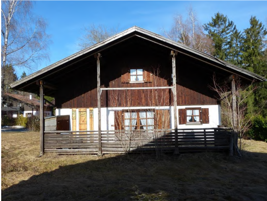
Ferienhaus, Ansicht von Süden