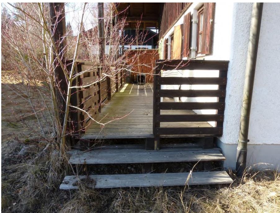
Ferienhaus, Teilansicht Veranda