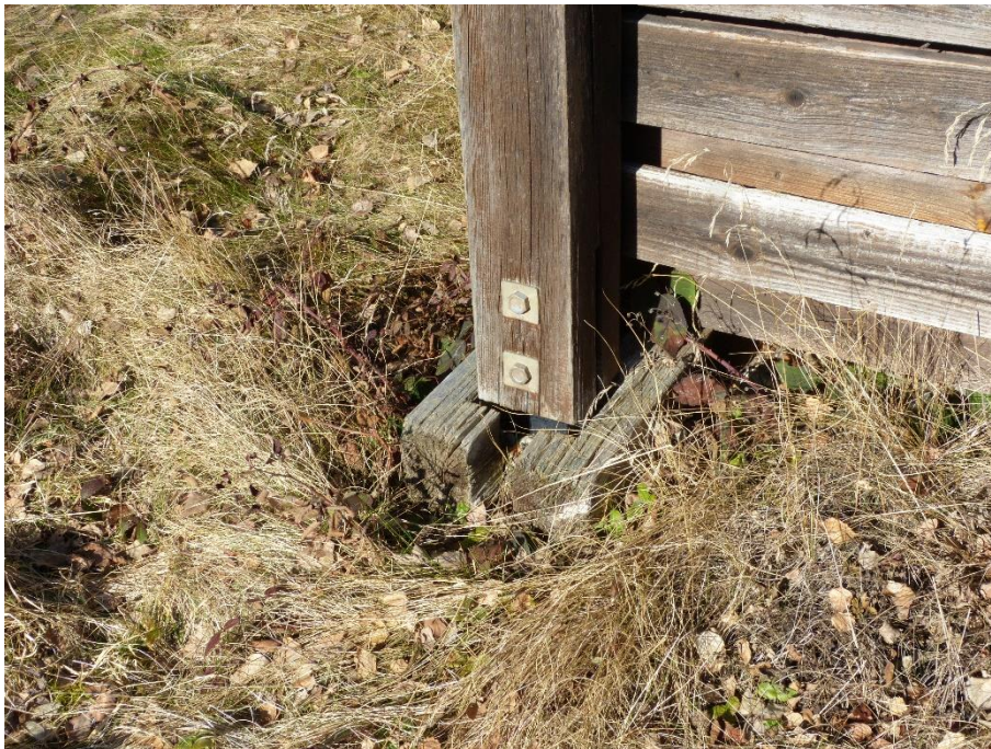
Ferienhaus, Teilansicht Stützfuß bei Veranda