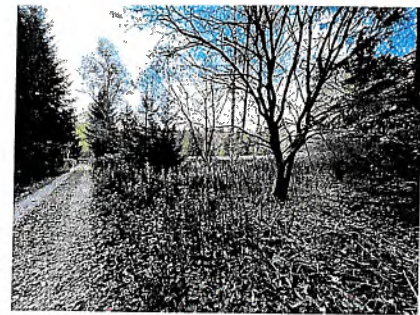
Flst. 2088, Blickrichtung Osten