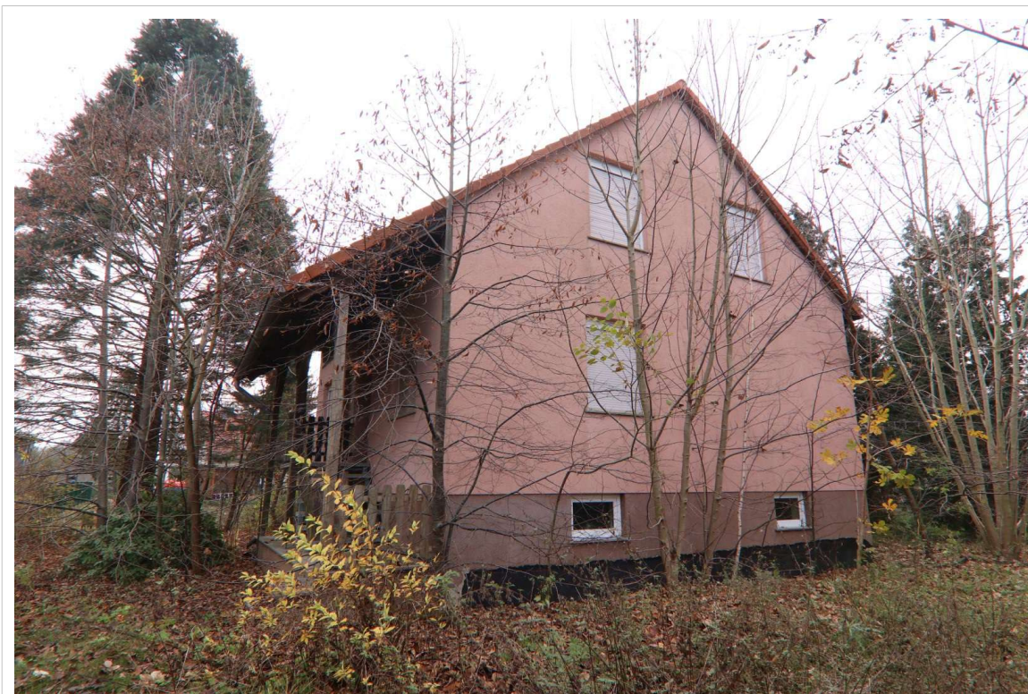
Blick auf den westlichen Giebel des Einfamilienhauses Rosengasse 5a in Niesky OT Kosel, das auf dem Flurstück 191 steht.

Es handelt sich im vorliegenden Fall um das in Niesky OT Kosel gelegene Grundstück Rosengasse 5 a . Das Grundstück ist insgesamt 3.652 m 2 groß und liegt auf den Flurstücken 191 und 192. Es ist mit einem massiv errichteten, unterkellerten Einfamilienhaus sowie auch einer Garage bebaut. Zum Wertermittlungsstichtag ist das Grundstück wohnlich nutzbar, es steht aber schon ca. 10 Jahre leer. Das Wohnhaus liegt als frei stehendes Einfamilienhaus vor. Es ist unterkellert und besitzt Erdgeschoss und ausgebautes Dachgeschoss. Das Baujahr des Hauses ist laut Bauzeichnungen mit 1995 angegeben. Es herrscht zum Wertermittlungsstichtag ansonsten ein einfacher Zustand vor. Dieser Zustand ist durch den langen Leerstand und durch die fehlende Bewirtschaftung stark in Mitleidenschaft gezogen worden. Als ein Beispiel sind die an vielen Stellen hochgefrorenen Fliesenböden im Keller zu nennen, die bei regelmäßiger Beheizung in einem normalen Zustand wahrscheinlich erhalten geblieben wären.