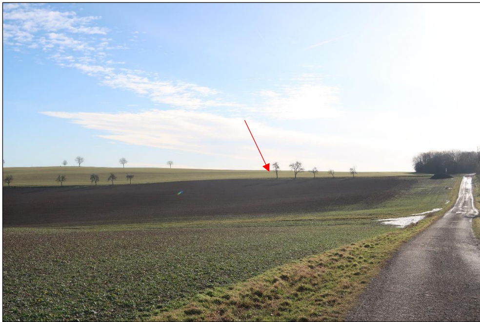
Bild 1: Blick von Norden entlang des Wirtschaftsweges „Alter Viehweg“