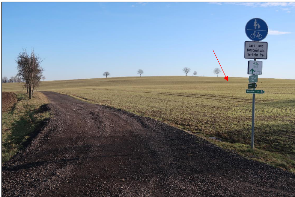
Bild 2: Blick vom Kreuzungsbereich norwestlich des Grundstücks auf den Feldblock