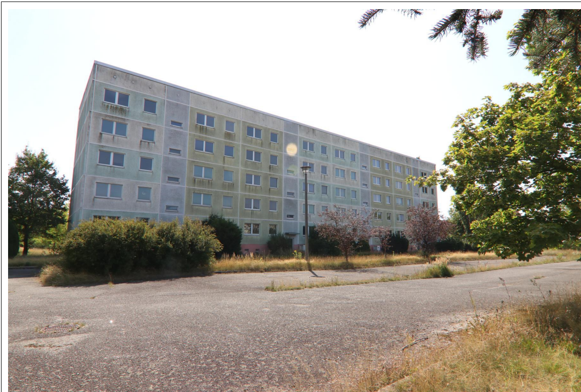
Blick auf die nordwestliche Fassade des Wohnblocks Südstraße 1 - 4 in Rothenburg/O.L..

Es handelt sich im vorliegenden Fall um das in Rothenburg/O.L. gelegene Grundstück Südstraße 1 - 8 . Das Grundstück besteht nur aus dem Flurstück 850/59 der Flur 1 in der Gemarkung Rothenburg/O.L. und weist eine Größe von 10.244 m 2 auf.