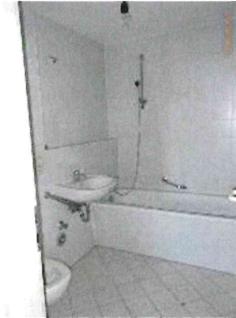
Bad der besichtigten Leerwohnung Nr. 20