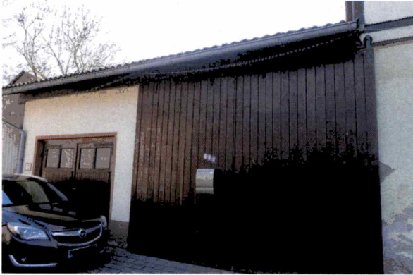
Nebengebäude mit Torfahrt