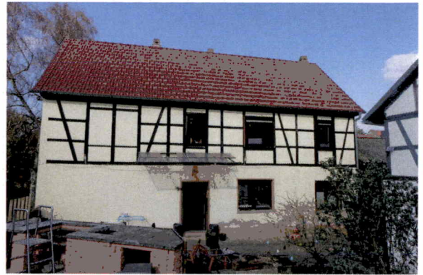
Wohnhaus Ansicht vom Innenhof