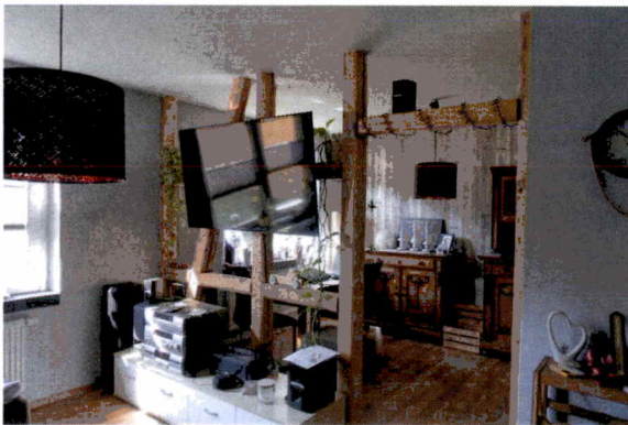
Wohnraum im EG