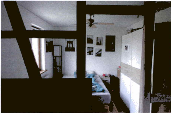
Zimmer im OG