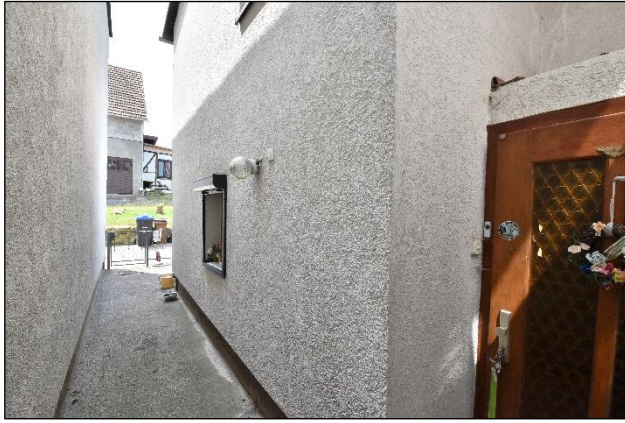
Durchgang mit Haustür, Blick nach Süden