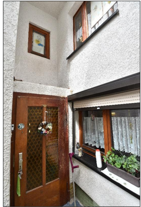
Wohnhaus, Hinterseite mit Hauseingangstür, Südostansicht