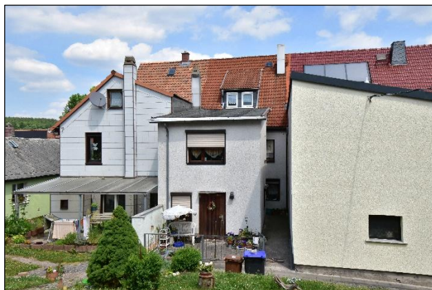
Gebäudehinterseite mit Anbau und Durchgang zum Eingang (Bildmitte), Blick nach Norden