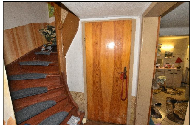
Treppe zum Obergeschoss und Blick zum Bad