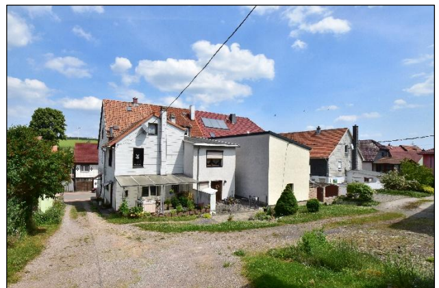
Gebäudekomplex mit angrenzenden Reihenhäusern und Erschließungssituation über Flurstück 35 (Vordergrund)