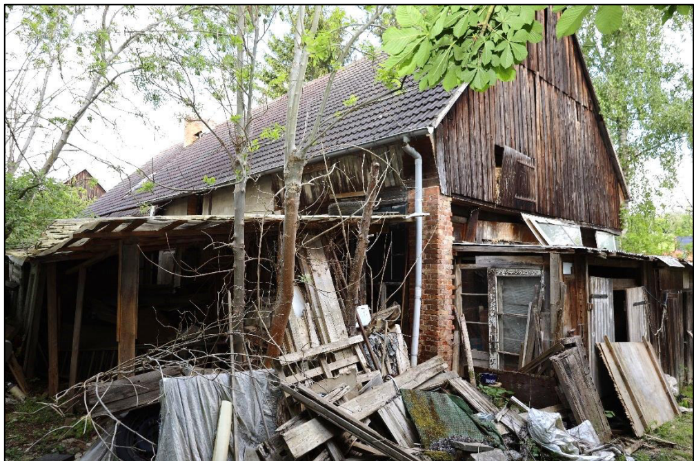
Südostansicht – Scheunenanbau am Wohnhaus