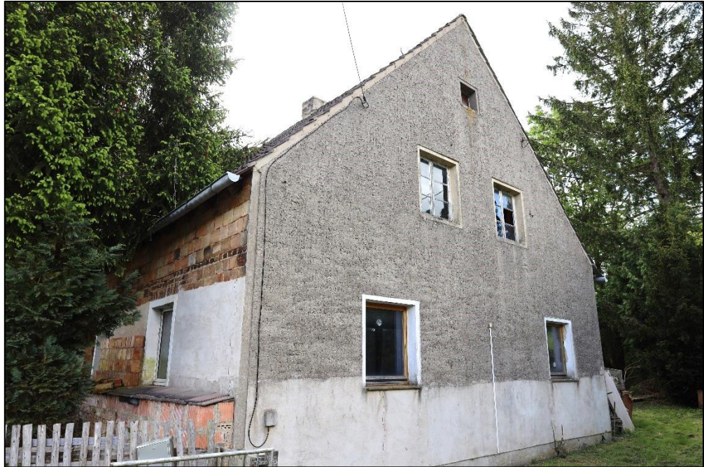
Nordwestansicht – Wohnhaus