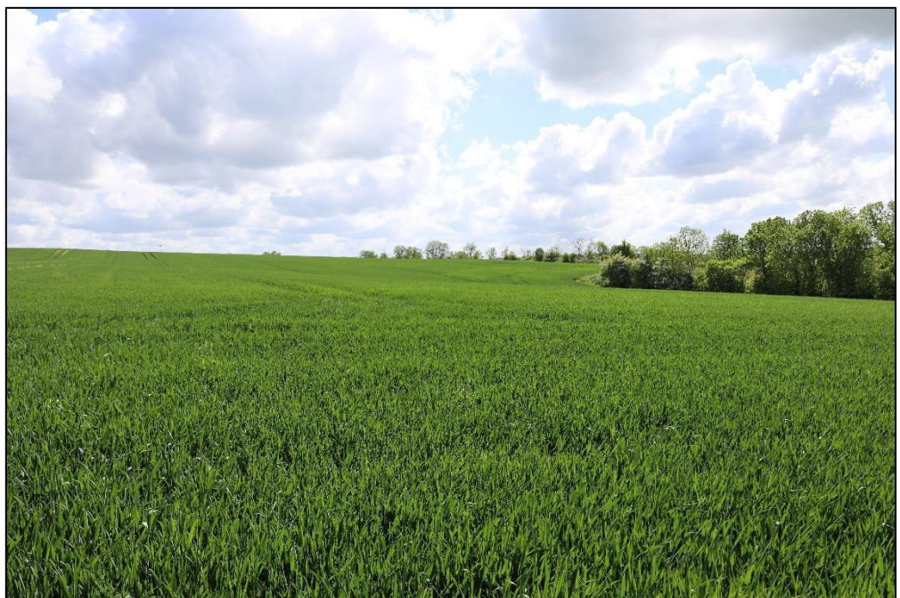
Ackerland (Flurstück Nr. 344)