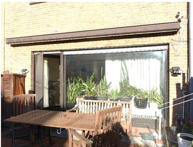
Bild 3 Terrasse zur Straßenseite