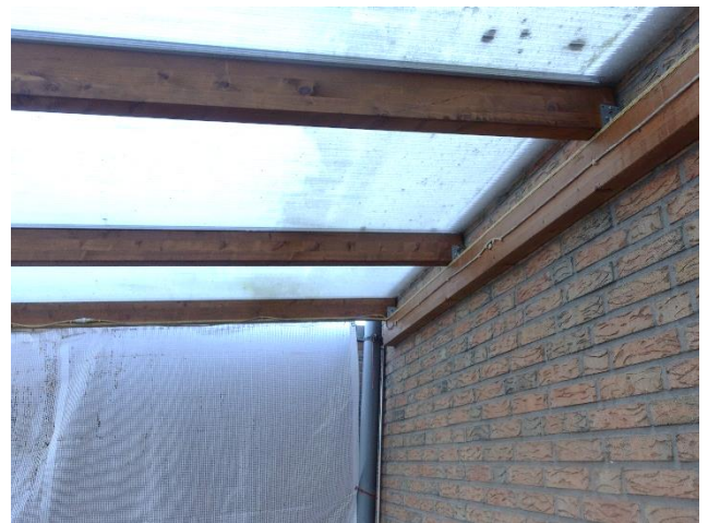
Bild 4 rückwärtige Terrasse