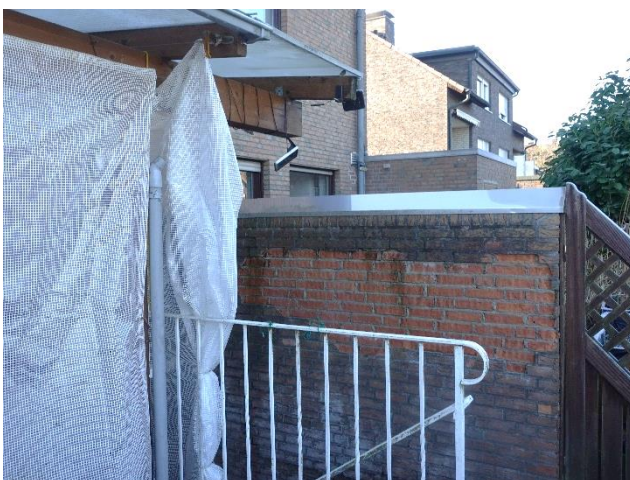
Bild 5 rückwärtige Terrasse /Kelleraußentreppe