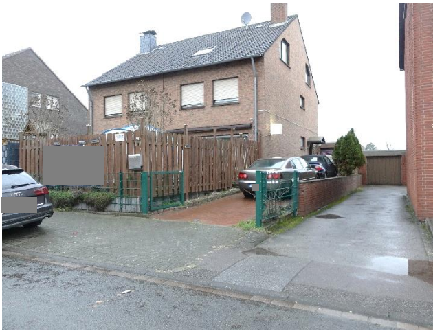
Bild 1 Vorderansicht

Lichtbilddokumentation - Aufnahmen vom 07.02.2023