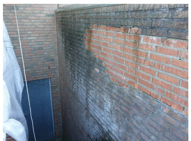
Bild 6 Detailaufnahmen Feuchteschäden Stützwand

Dem Sachverständigen liegt keine Genehmigung zur Veröffentlichung der Innenfotografien des Hauses vor.