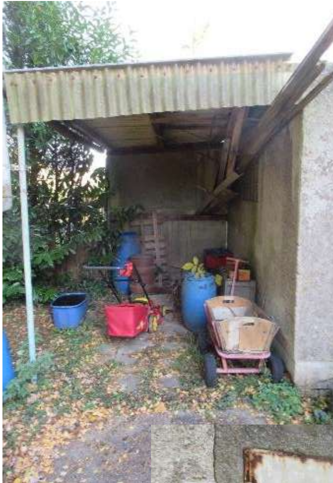
überdachte Stellfläche hinter der Garage