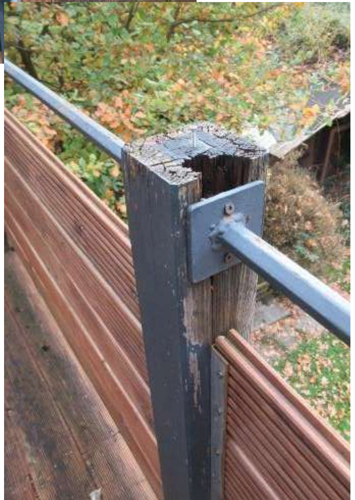
morsche Hölzer am Balkon