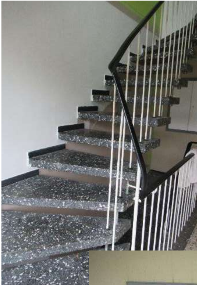
Treppe zum Dachgeschoss