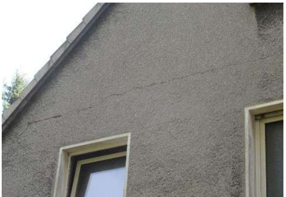
Riss in der Gartenfassade