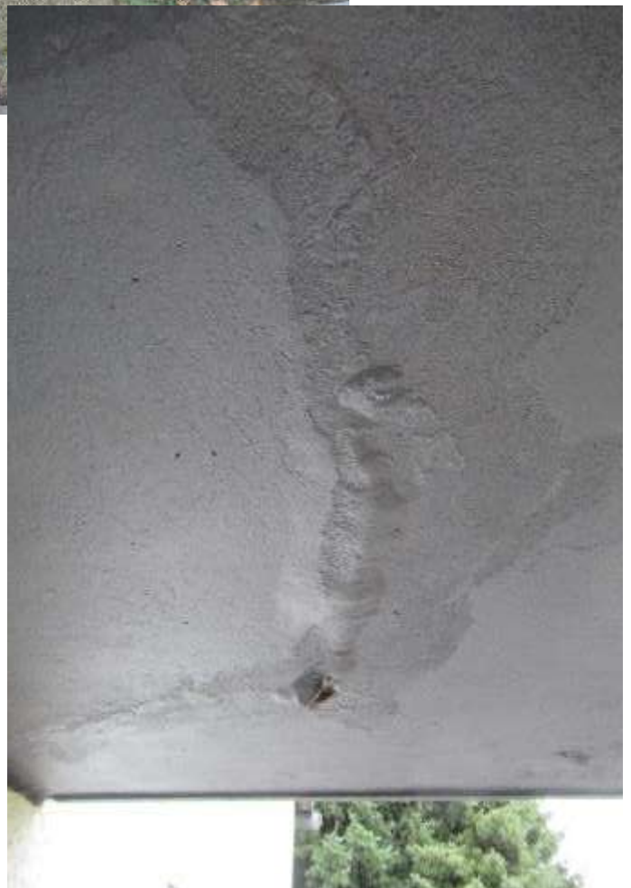
Durchfeuchtungen an der Unterseite der Kragplatte im Eingangsbereich