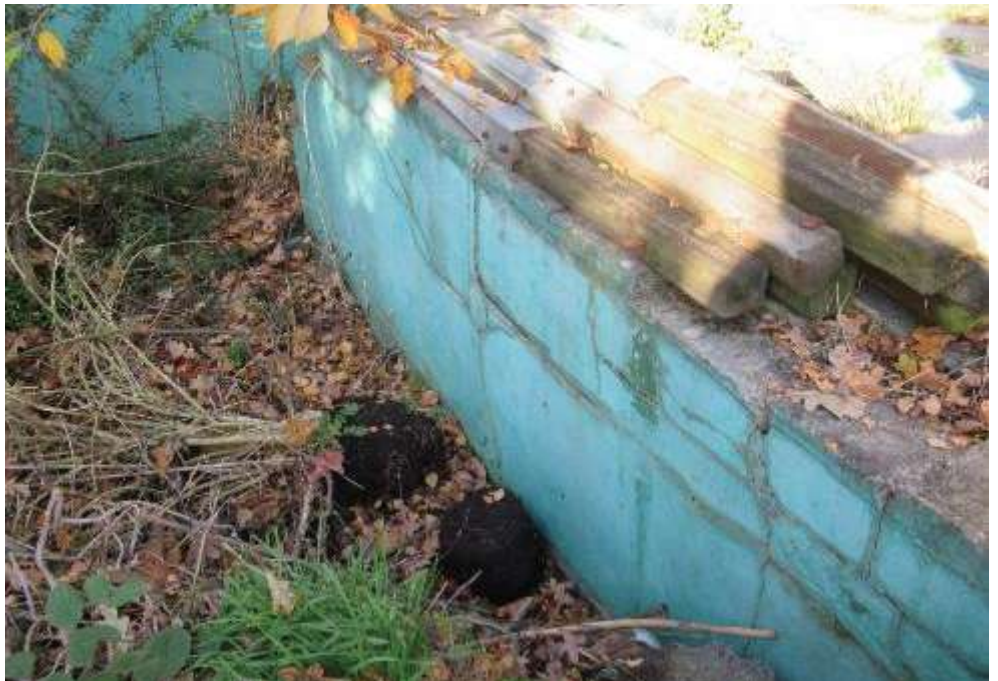
Schäden am Gartenpool