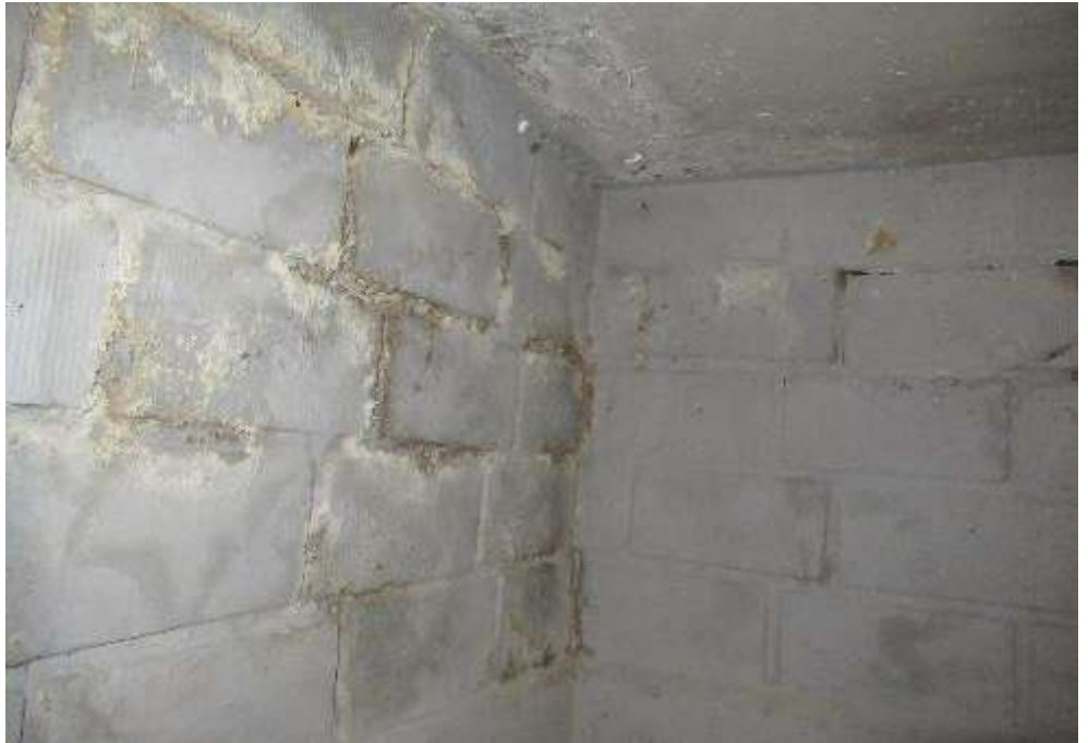
Durchfeuchtungen im Keller