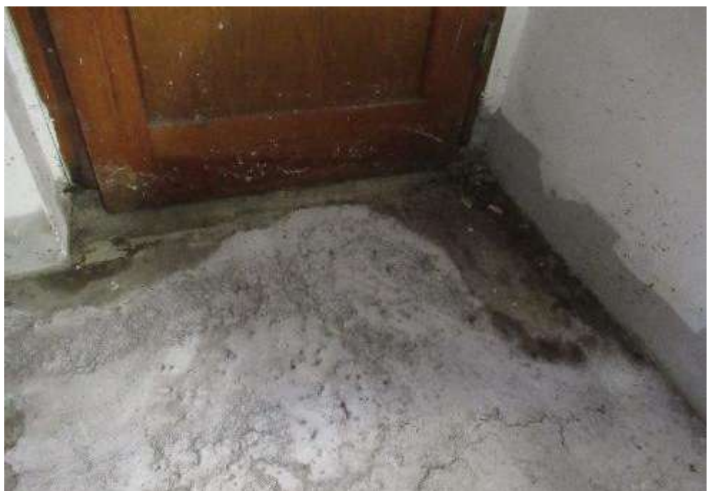
Durchfeuchtungen an der Kelleraußentür