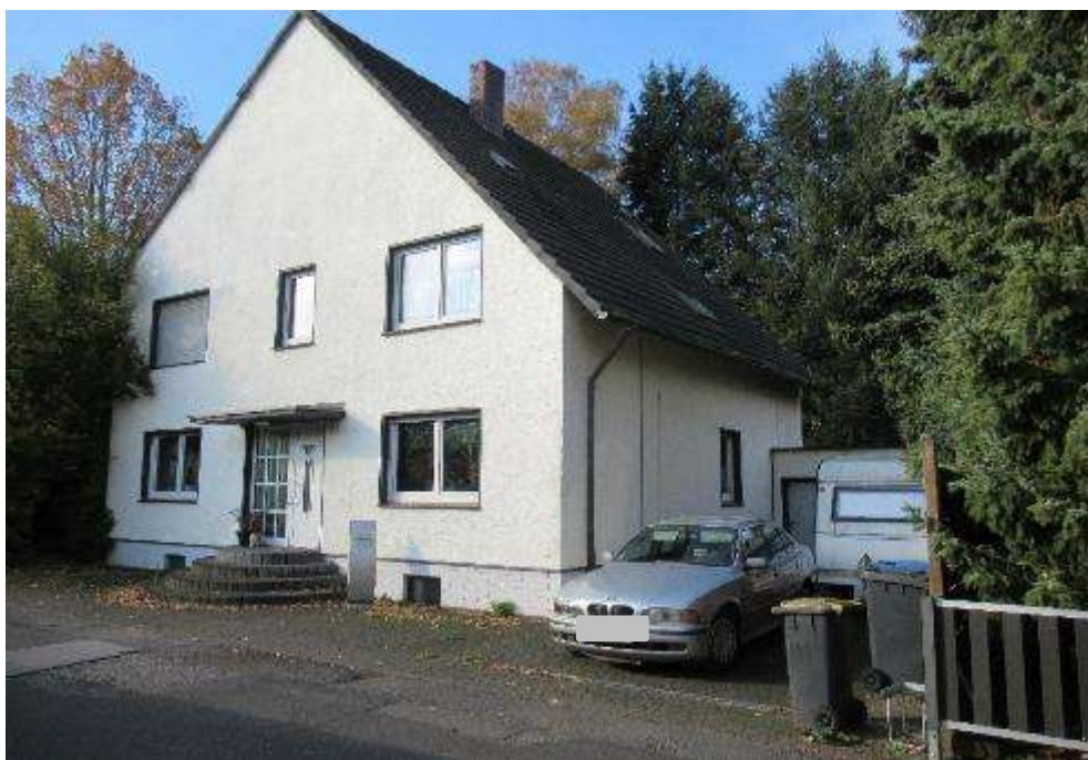
Straßenansicht Parkweg 20