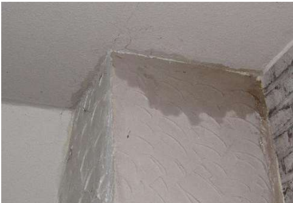
Durchfeuchtungen im Kaminbereich