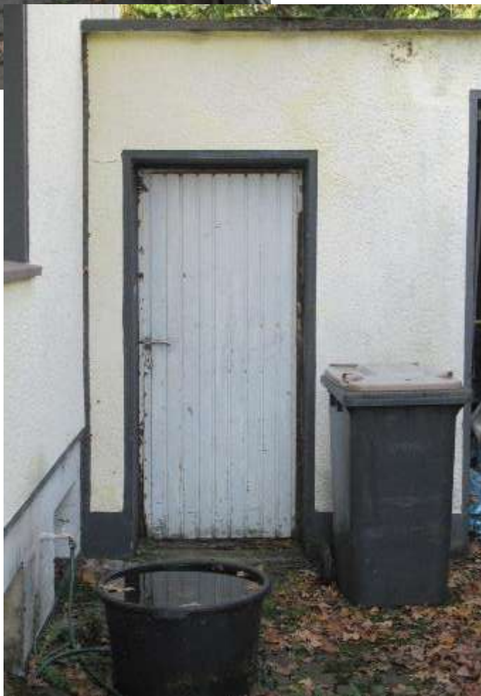
Mauer mit Öffnung zwischen Wohnhaus und Garage