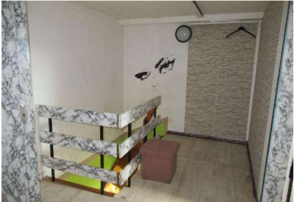
Ausgebauter Dachboden Flur