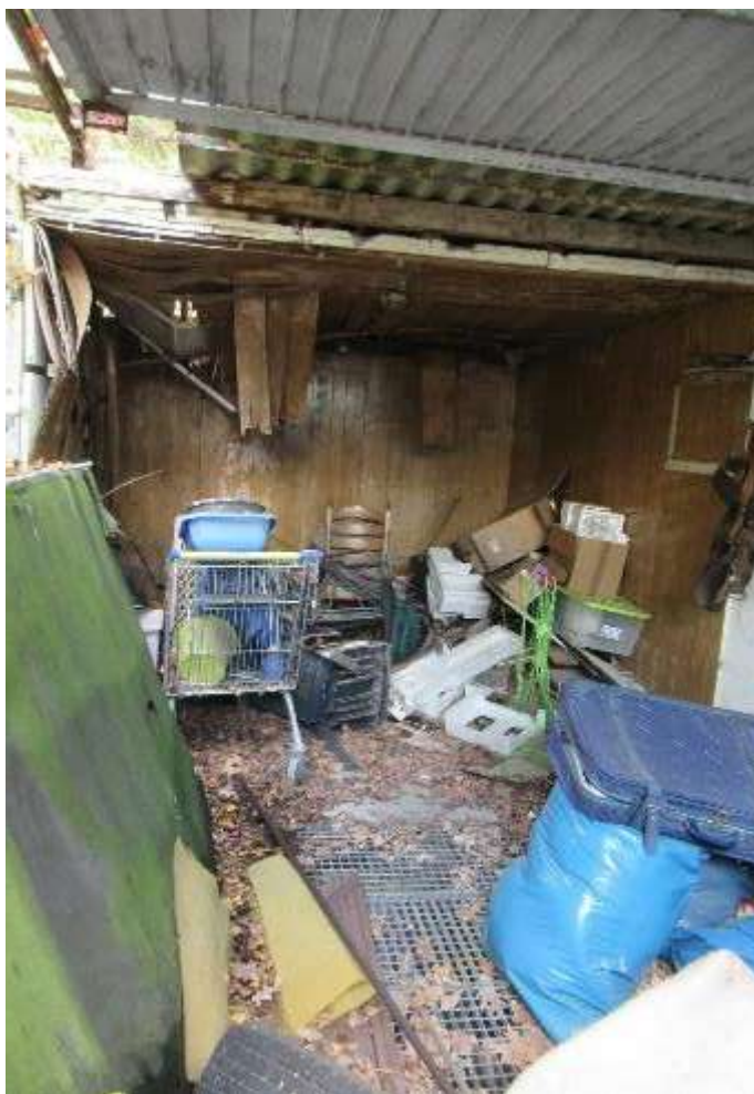
Einblick in die Garage