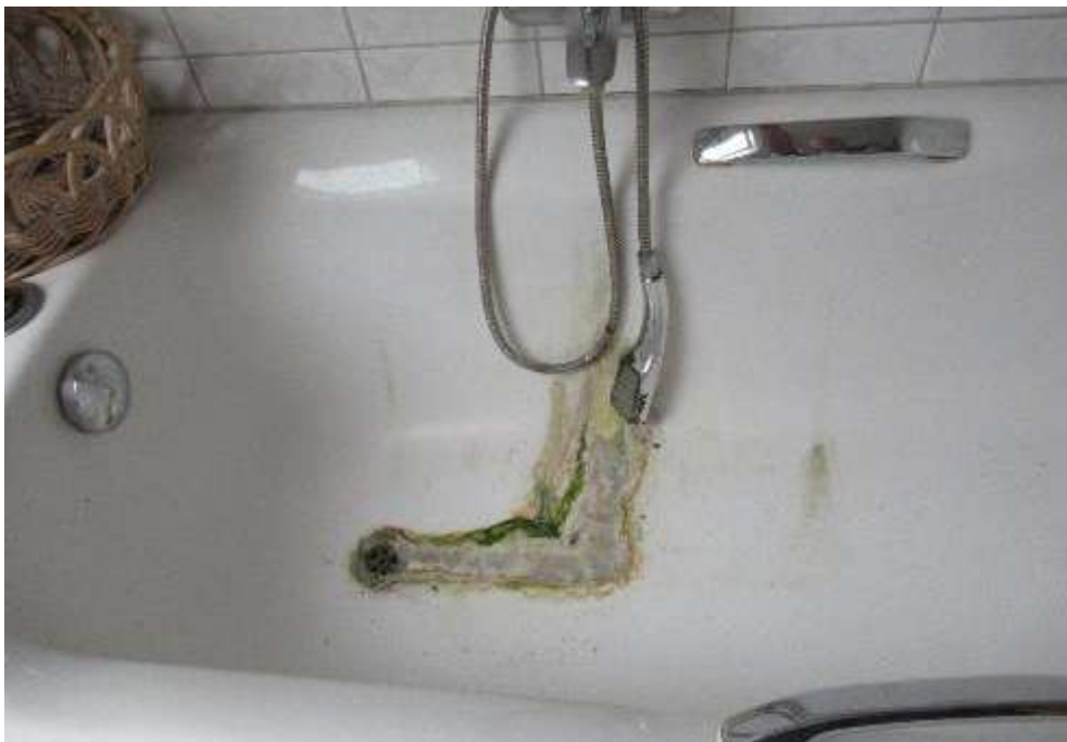
Schaden an der Wanne im Dachboden