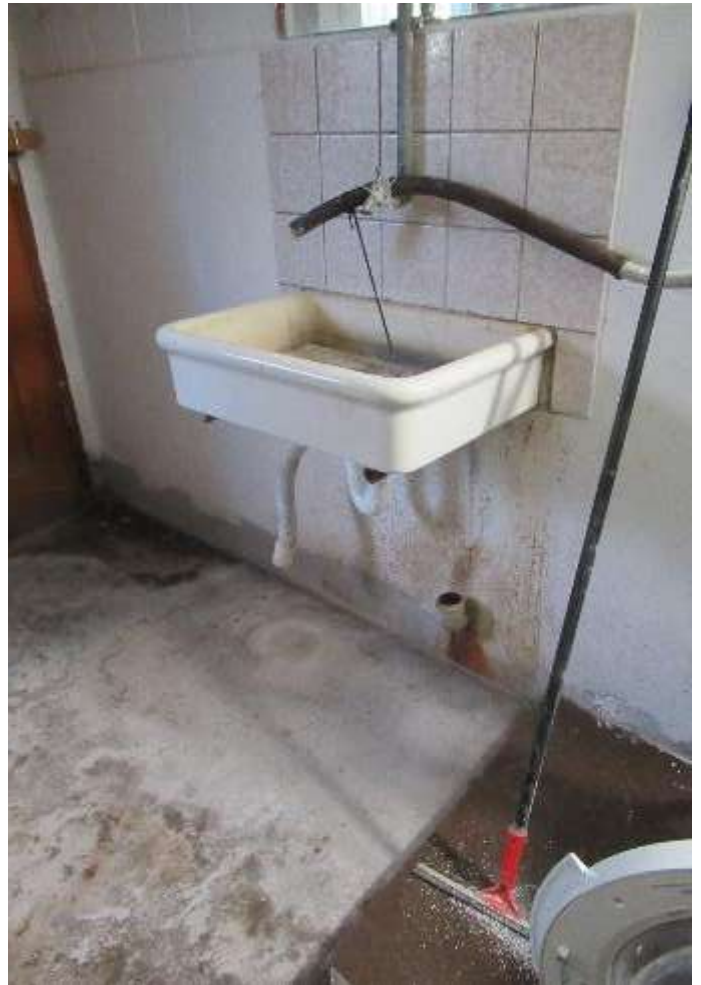
defekte Abwasserleitung im Waschkeller