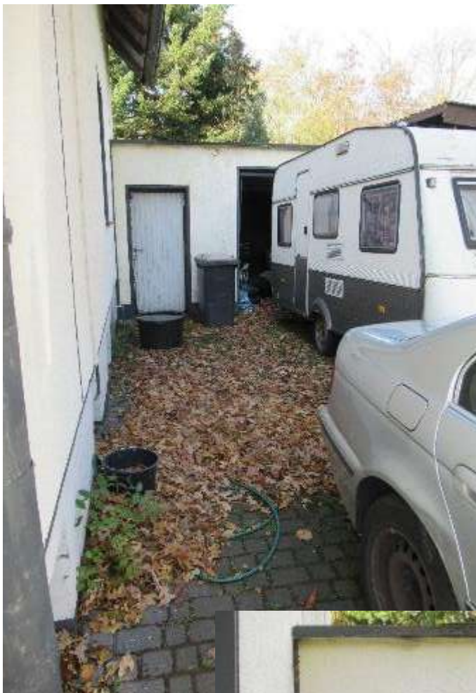
Zufahrt zur Garage