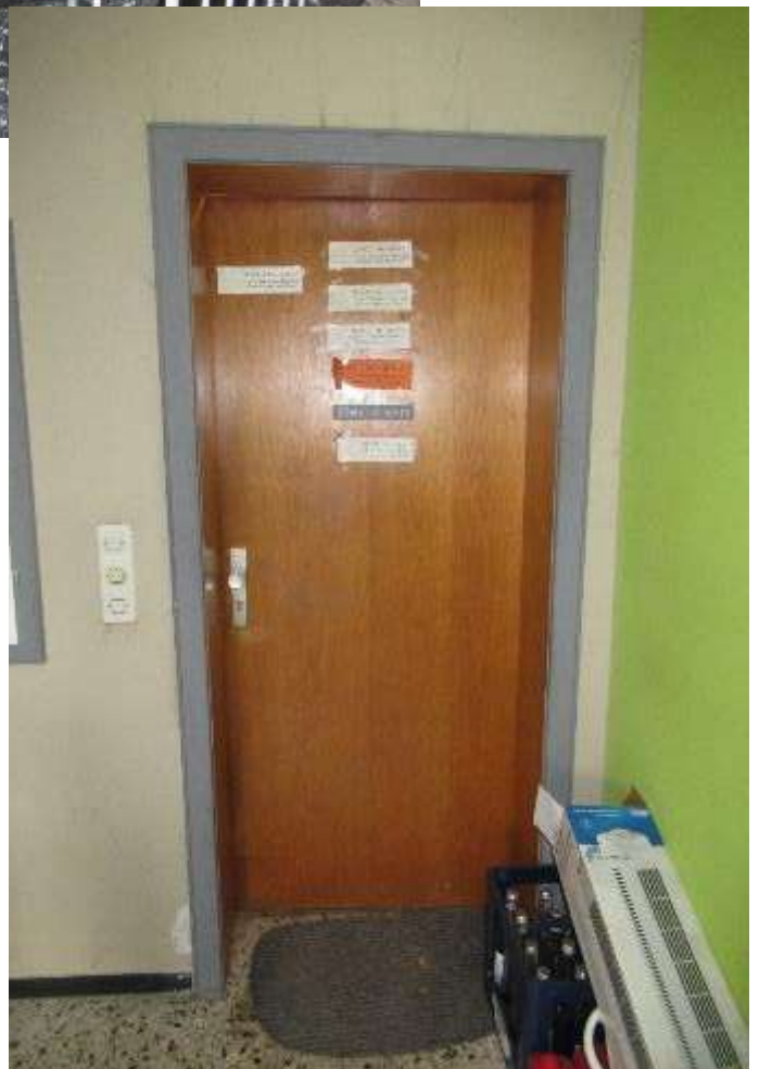
Wohnungs- abschlusstür im Erdgeschoss