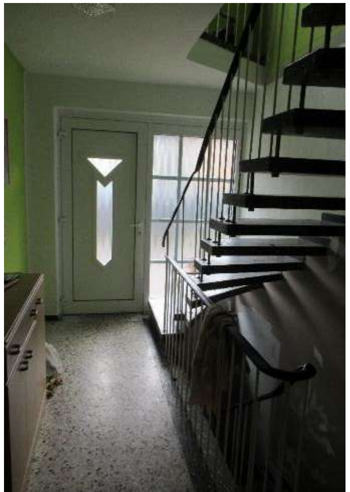
Treppenhaus im Erdgeschoss