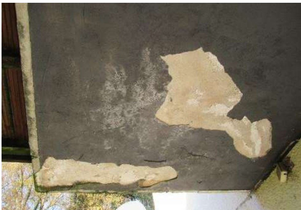
Durchfeuchtungen und Putzabplatzungen an der Unterseite des Balkons