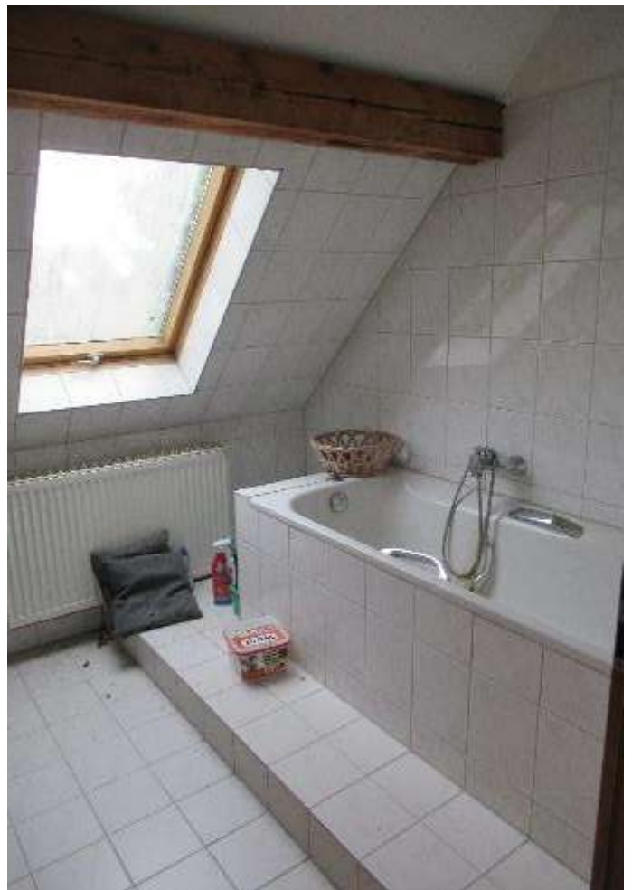
Bad im Dachboden