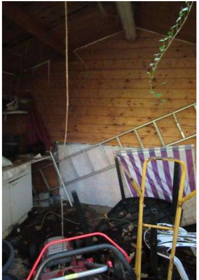
Einblick in das Gartenhaus