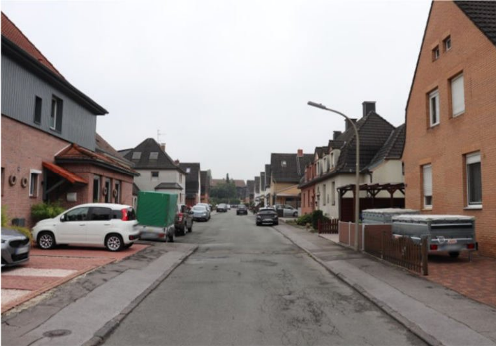
Bild 2 Straßensituation Kriemhildstraße -Blick in Richtung Norden-