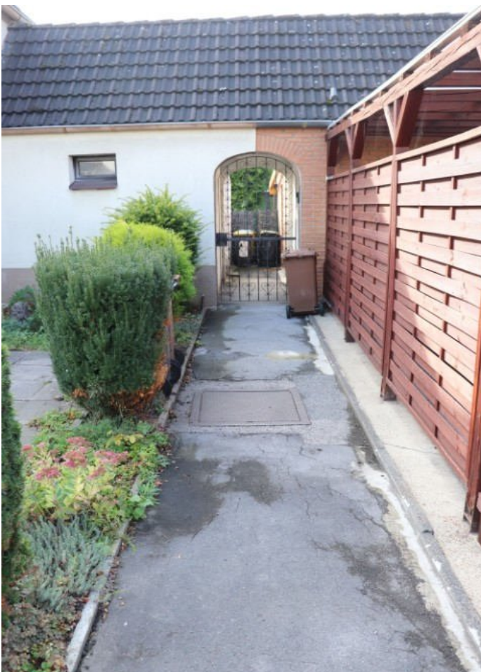
Bild 8 Gartenzuwegung (als gemeinschaftlicher Weg mit dem Nachbargrundstück)