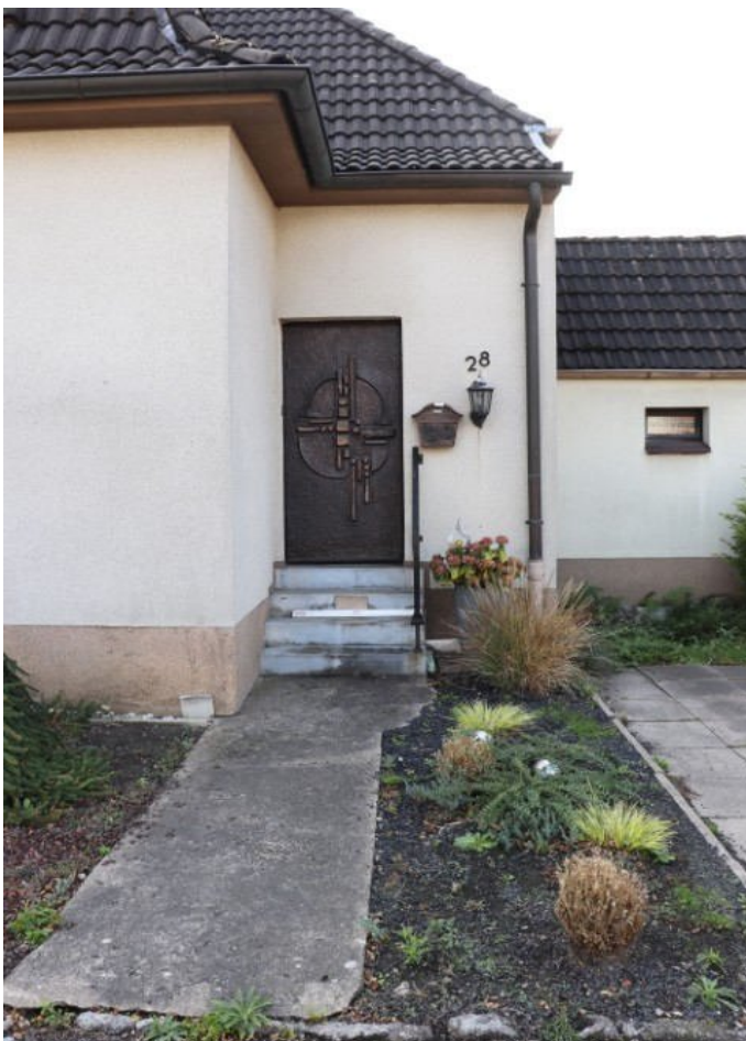
Bild 6 Kriemhildstraße 28 -Hauseingang rechter Gebäudeteil-