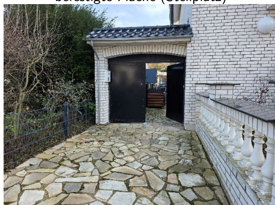
befestigte Fläche (Stellplatz)