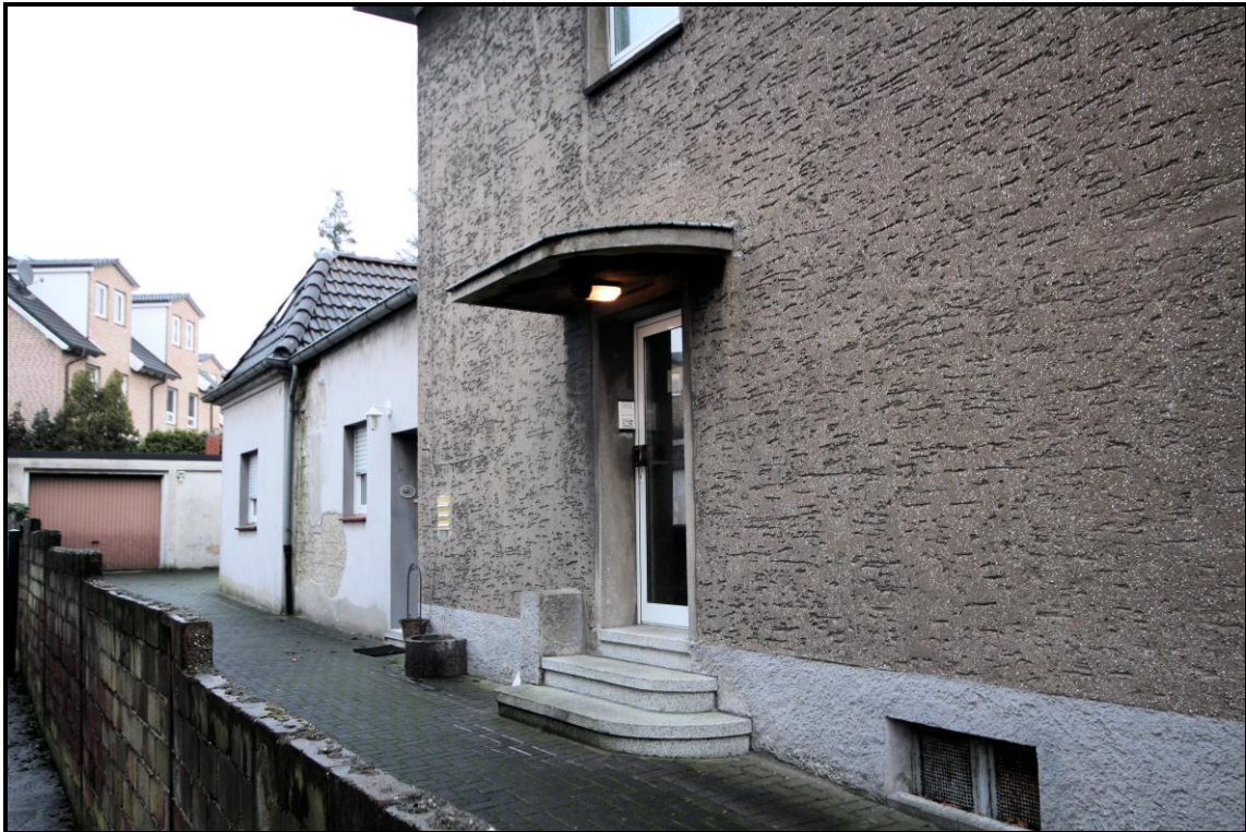
Bild 9: Beide Eingänge zum Wohnhaus (Haupthaus und Anbau) an der Nordwestseite