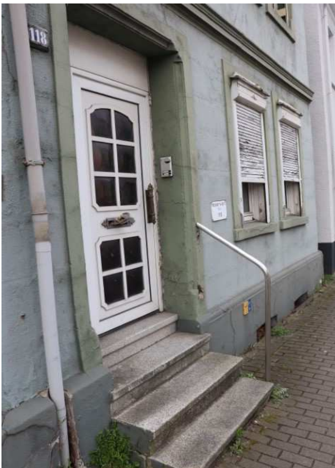
Bild 8 Hauseingang