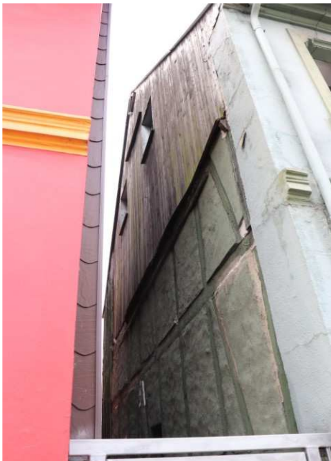
Bild 6 Wellinghofer Straße 118 -Ansicht Giebelseite Süd-