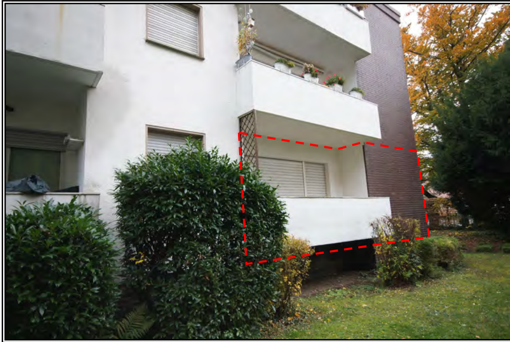
Bewertungsobjekt von Nordwesten