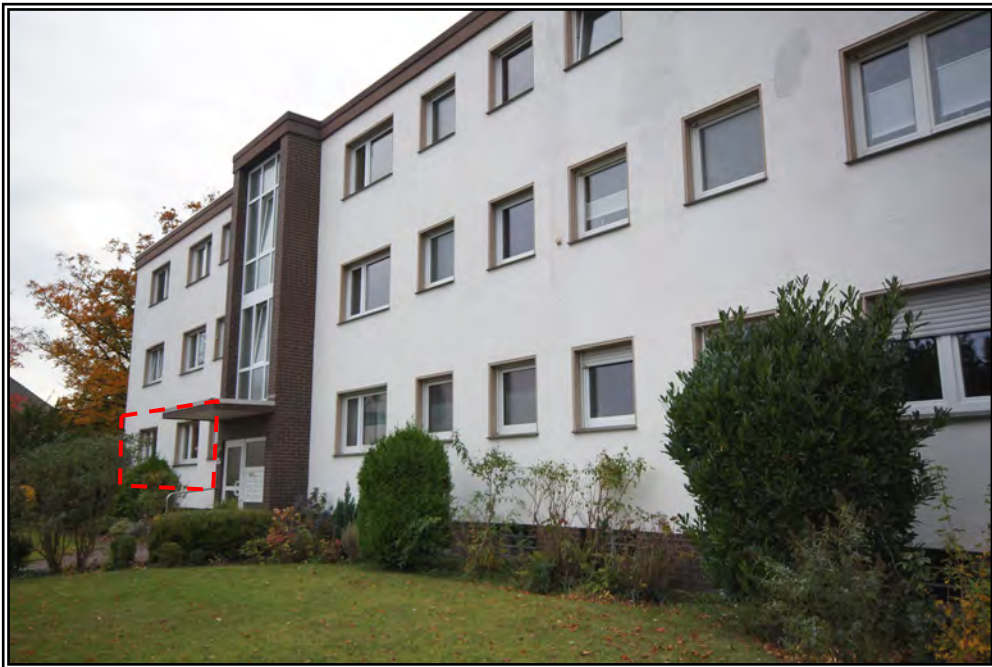
Gesamtgebäude von Südwesten