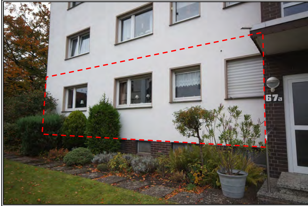
Ansicht von Nordosten