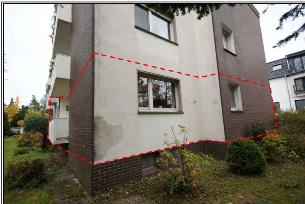
Seitenansicht von Südwesten