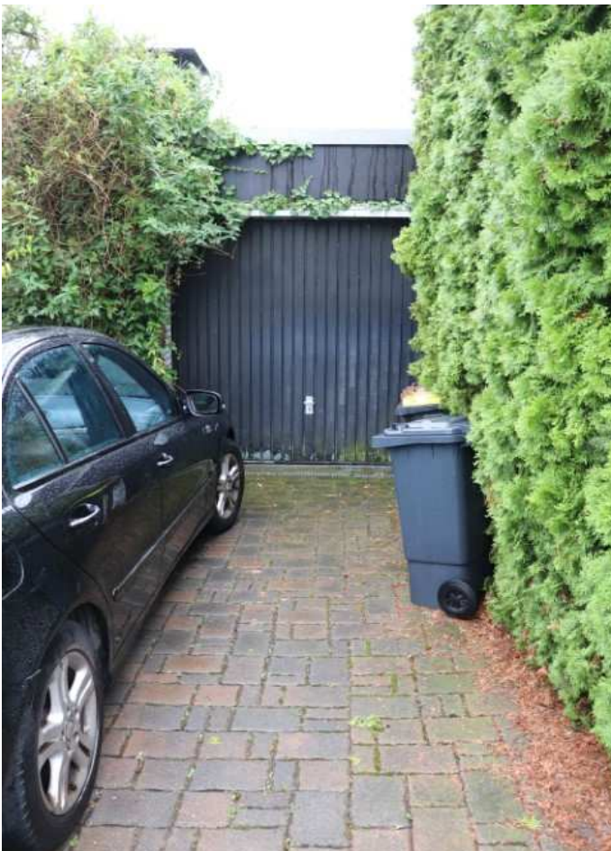
Bild 4 Garage