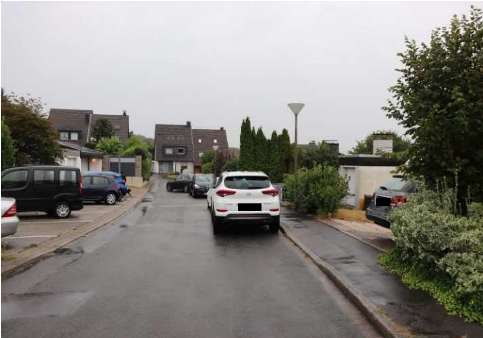
Bild 2 Straßensituation Krinkelweg/öffentlicher Gehweg entlang der südlichen Grundstücksgrenze -Blick in Richtung Südwesten-