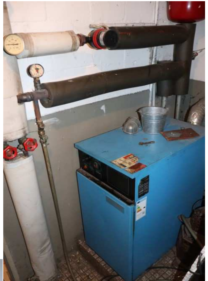
Bild 11 Untergeschoss, Kellerbereich -Heizungsanlage-