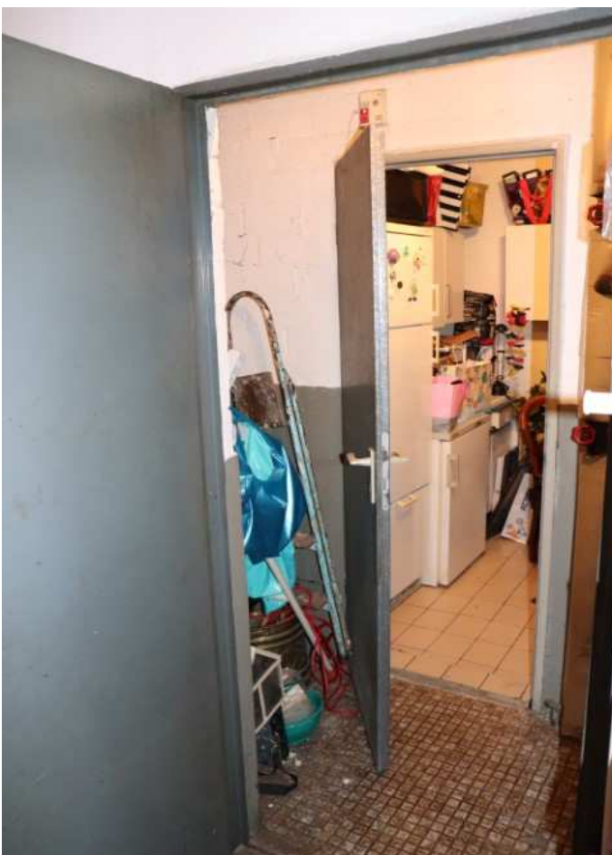
Bild 10 Untergeschoss, Kellerbereich -Heizungsraum-