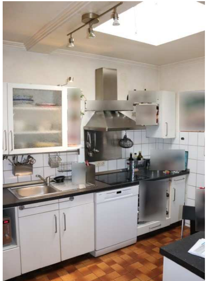
Bild 18 Erdgeschoss -Wohnen/Essen-