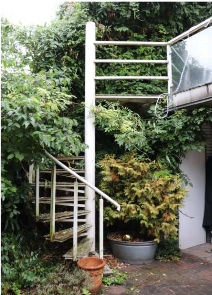
Bild 20 Erdgeschoss -Wendeltreppe vom Balkon in den Garten-