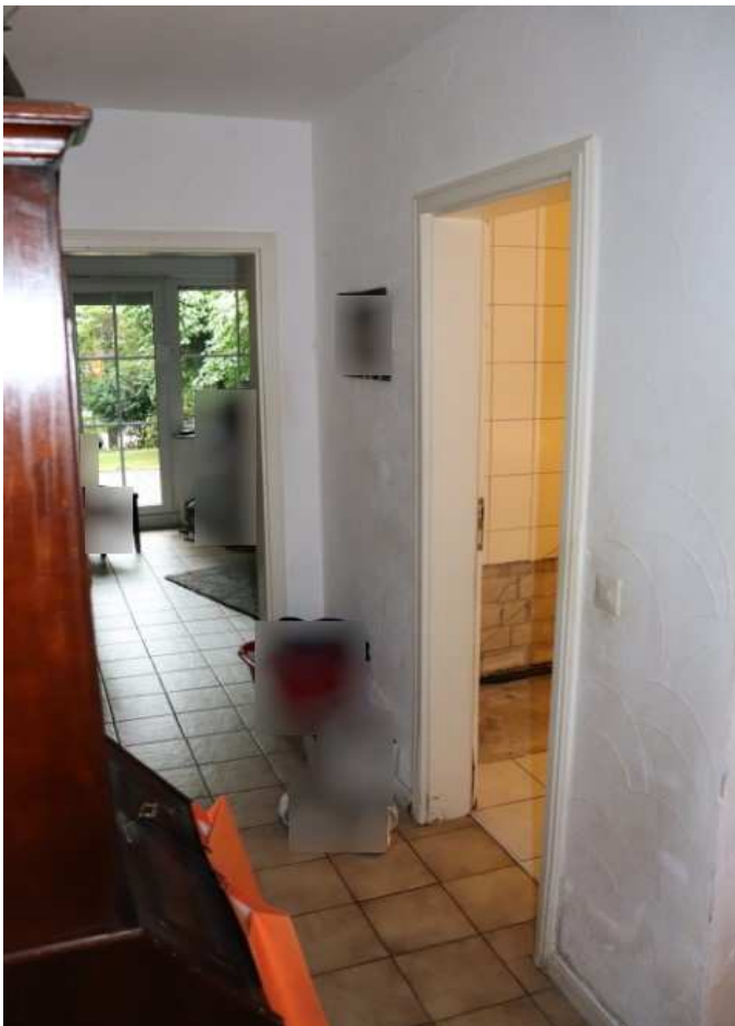
Bild 12 Untergeschoss, Wohnbereich -Flur-