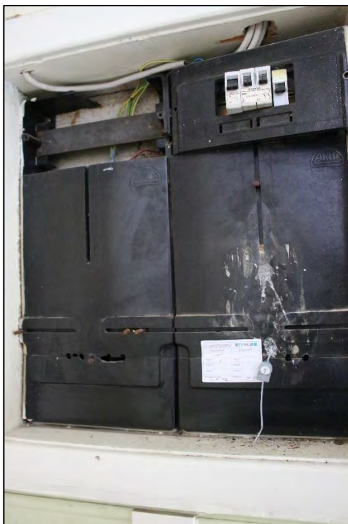
Foto Nr. 42: Gemeinschaftstreppehaus, 2. OG, Elektrounterverteilung