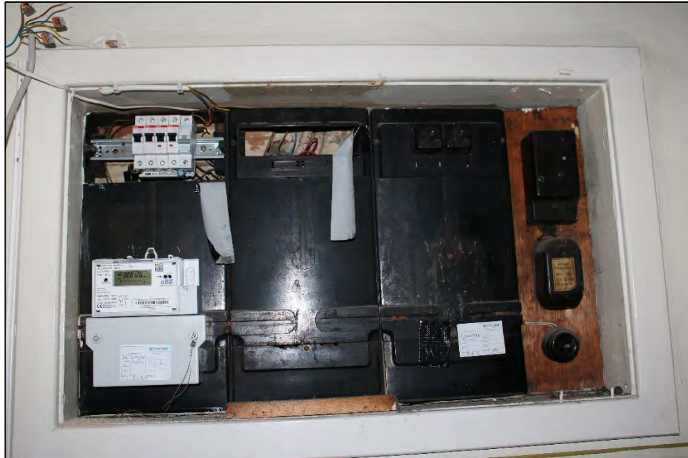
Foto Nr. 35: Gemeinschaftstreppe, Erdgeschoss, Elektrounterverteilung