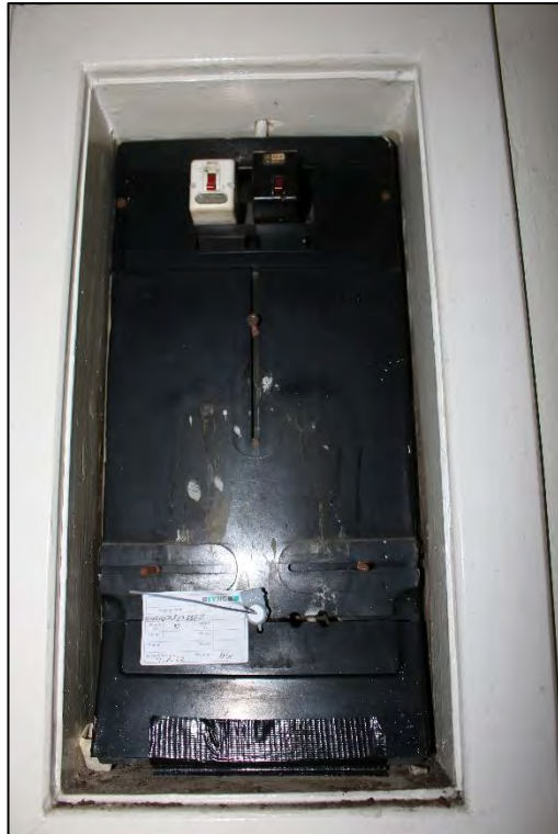
Foto Nr. 39: Gemeinschaftstreppehaus, 1. OG, Elektrounterverteilung