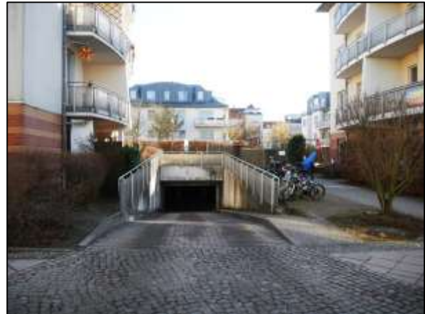
Tiefgaragen-Ein- und Ausfahrt a.d. Grdst.