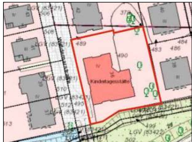
Flurkarte (Grundstück Waldemarstr. 36)