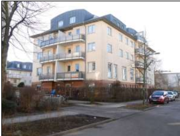
Wohngebäude a.d. Grdst. Waldemarstr. 36