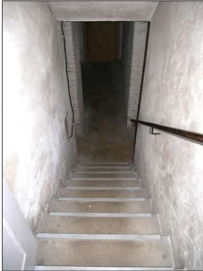
eingehauster Kellertreppen- abgang im Ge- bäudeteil Jo- hann-Sigis- mund-Str. 9