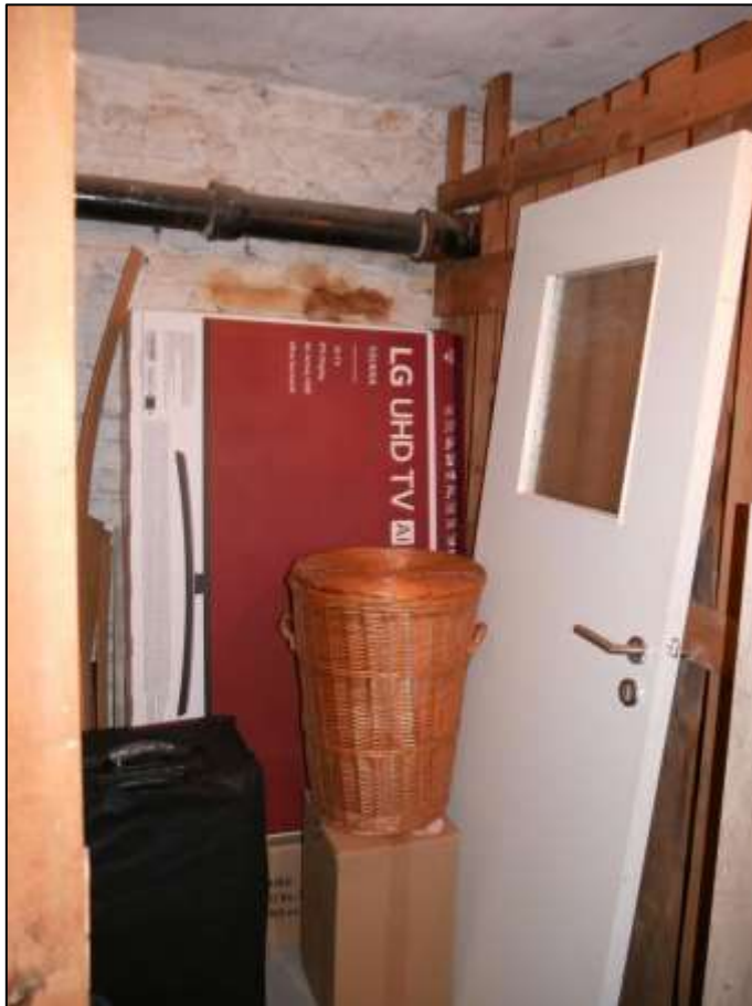
Blick in den dem Wohnungseigentum Nr. 34 zugewiesenen Abstellverschlagent mit eingelagerter Küchentür