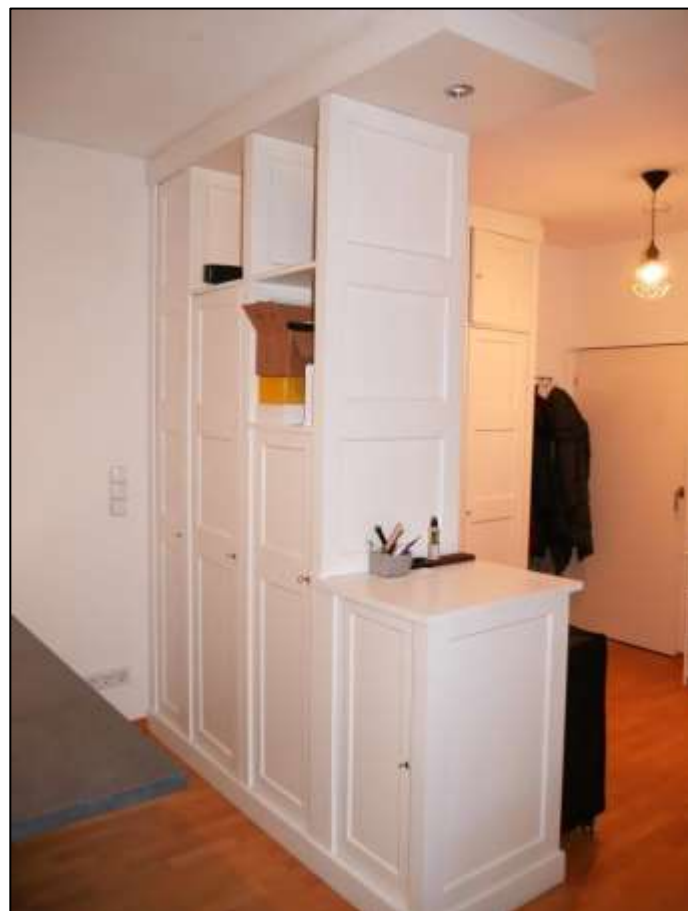
offene Diele des Wohnungseigentums Nr. 34 im 1.OG postalisch links im Gebäudeteil Johann-Sigismund-Str. 9 mit Einbaumobiliar anstelle einer im Teilungsplan ausgewiesenen Abstellkammer - Wohnungseingangstür im Hintergrund