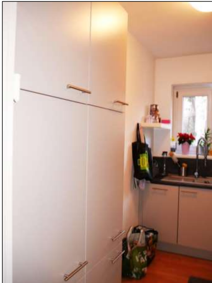
Küche des Wohnungseigentums Nr. 34 im 1.OG postalisch links im Gebäudeteil Johann-Sigismund-Str. 9