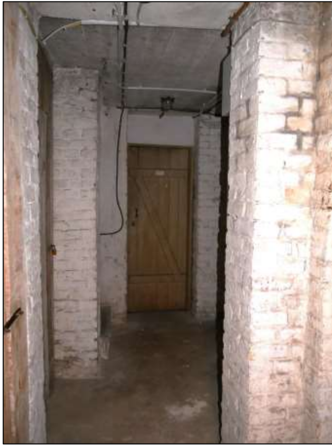
Kellerflur im Gebäudeteil Johann-Sigismund-Str. 9