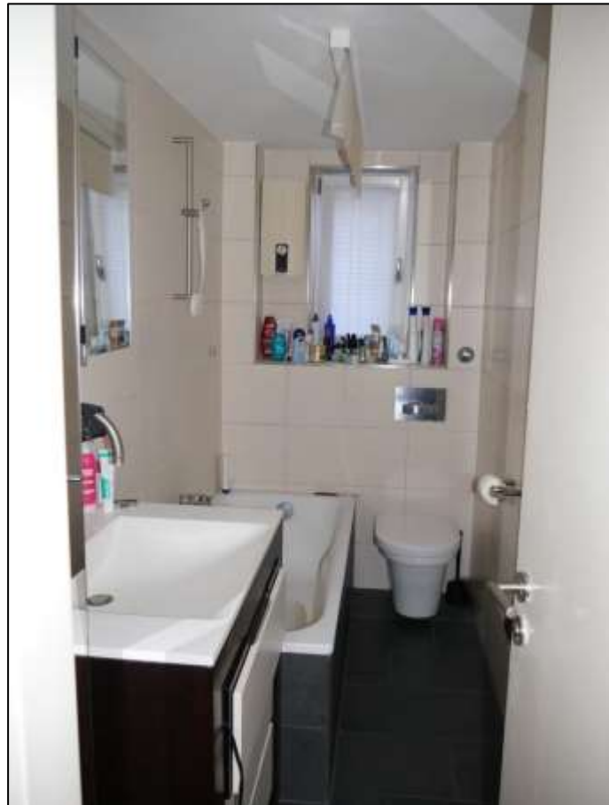
Badezimmer des Wohnungseigentums Nr. 34 im 1.OG postalisch links im Gebäudeteil Johann-Sigismund-Str. 9