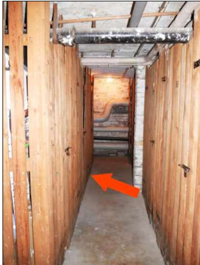
Kellerflur im Gebäudeteil Johann-Sigismund-Str. 9 mit Lage des dem Wohnungseigentum Nr. 34 zugewiesenen Holzlatten-Ver-schlags als vor-letzter Ver-schlag auf der im Bild linken Seite (Pfeil)