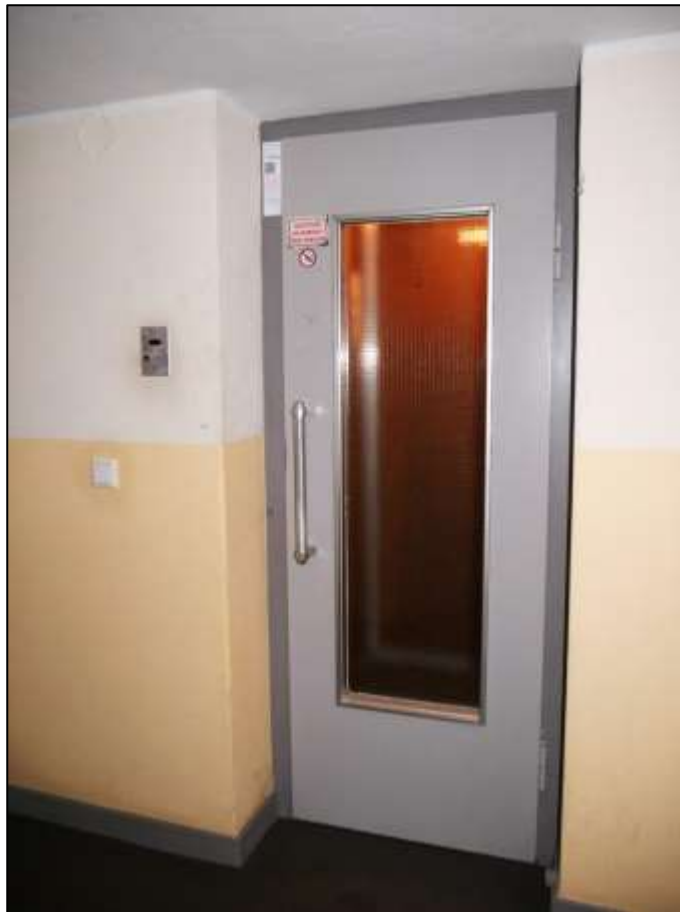
Aufzugsanlage aus dem Jahre 1955 im Ge- bäudeteil Jo- hann-Sigis- mund-Str. 9