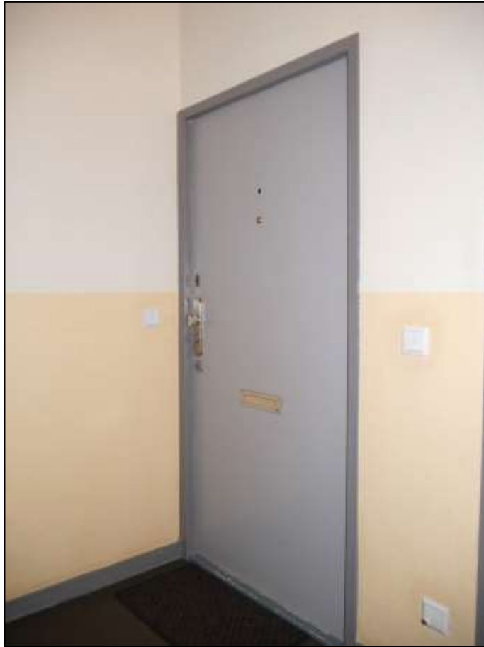
Eingangstür des Wohnungseigentums Nr. 34 im 1.OG postalisch links im Gebäudeteil Johann-Sigismund-Str. 9