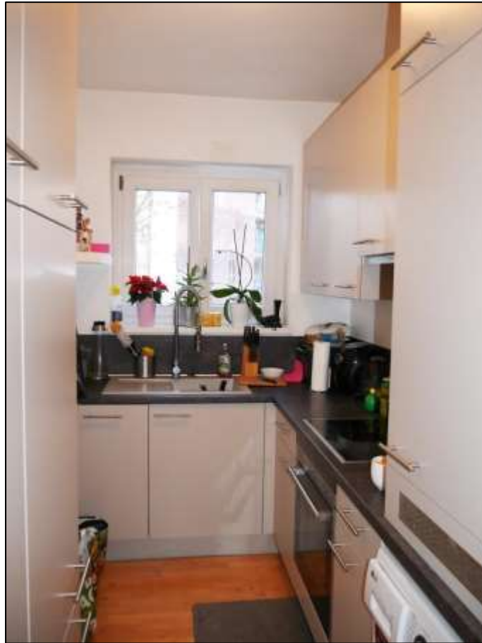
Küche des Wohnungseigentums Nr. 34 im 1.OG postalisch links im Gebäudeteil Johann-Sigismund-Str. 9