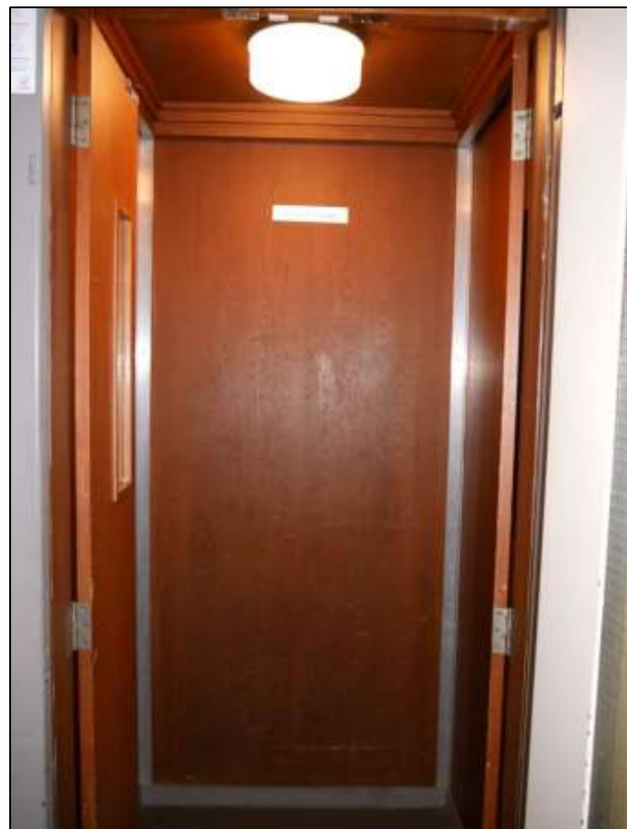
Aufzugsanlage mit Innenklapp- Türen noch aus dem Jahre 1955 und Mo- dernisierung der Anlage im Jahre 2023 im Gebäudeteil Johann-Sigis- mund-Str. 9