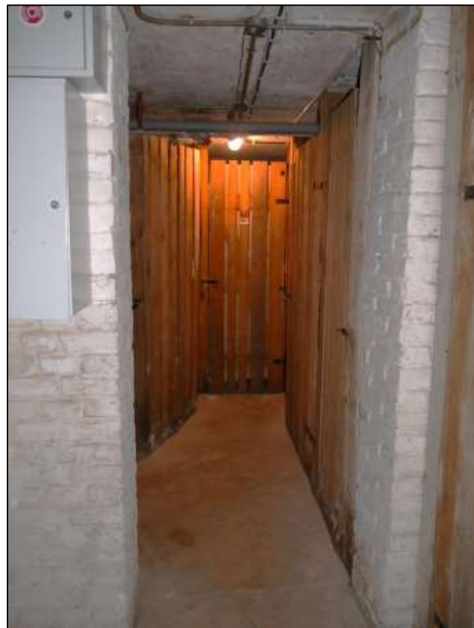
Kellerflur im Gebäudeteil Johann-Sigis- mund-Str. 9