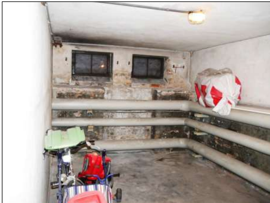
Fahrrad- und Kinderwagenabstellkeller im Gebäudeteil Johann-Sigismund-Str. 9