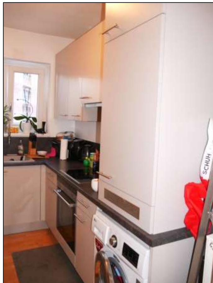
Küche des Wohnungseigentums Nr. 34 im 1.OG postalisch links im Gebäudeteil Johann-Sigismund-Str. 9