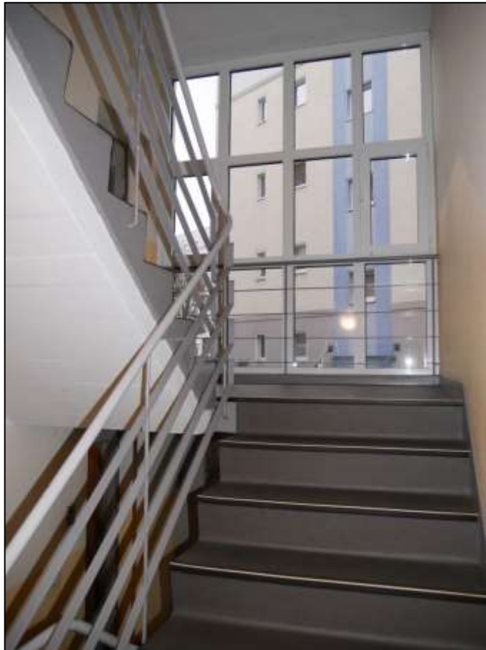
Treppenhaus- aufgang im Gebäudeteil Johann-Sigis- mund-Straße 9