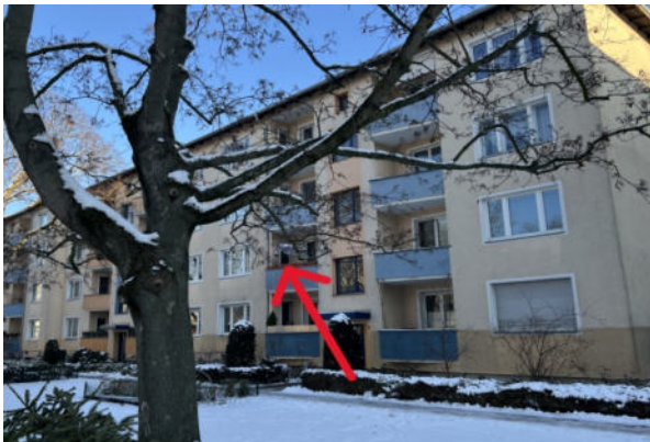
Ansichten Gebäude vorne und hinten: