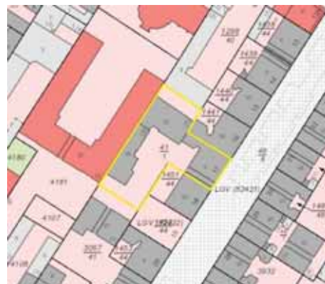
Ausschnitt Katasterkarte, Kennzeichnung Bewertungsgrundstück gelb

Hinweis: Die Verkehrswertermittlung erfolgt auf der Grundlage einer Außenbesichtigung.