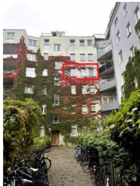
Vorderansicht Hinterhaus mit Kennzeichnung WE Nr. 27