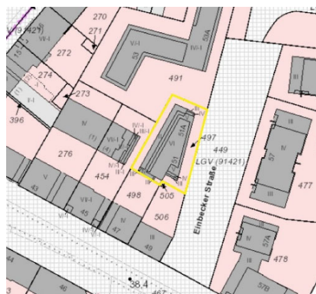
Ausschnitt Katasterkarte, Kennzeichnung Bewertungsgrundstück gelb

Hinweis: Die Verkehrswertermittlung erfolgt auf der Grundlage einer Außenbesichtigung.