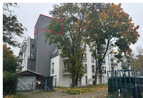
Straßen-/Seitenansicht mit Kennzeichnung Sondereigentum WE Nr. 37