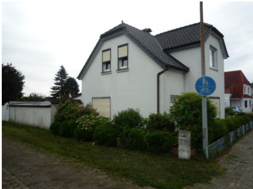
Wohnhaus mit angebautem Nebengebäude, Südwestansicht