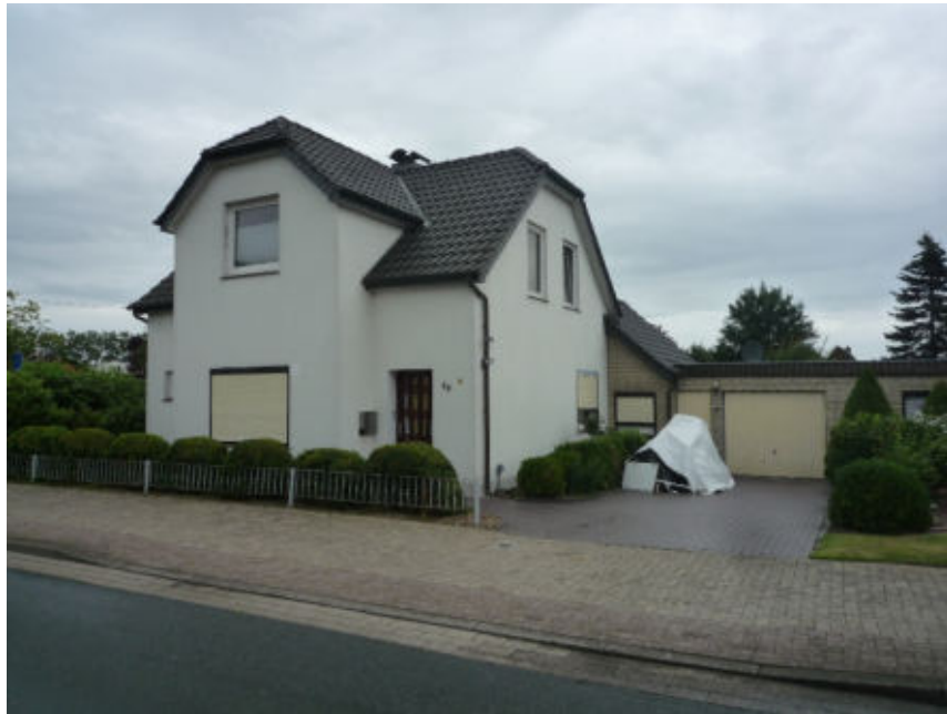
Wohnhaus mit Garage, Südostansicht