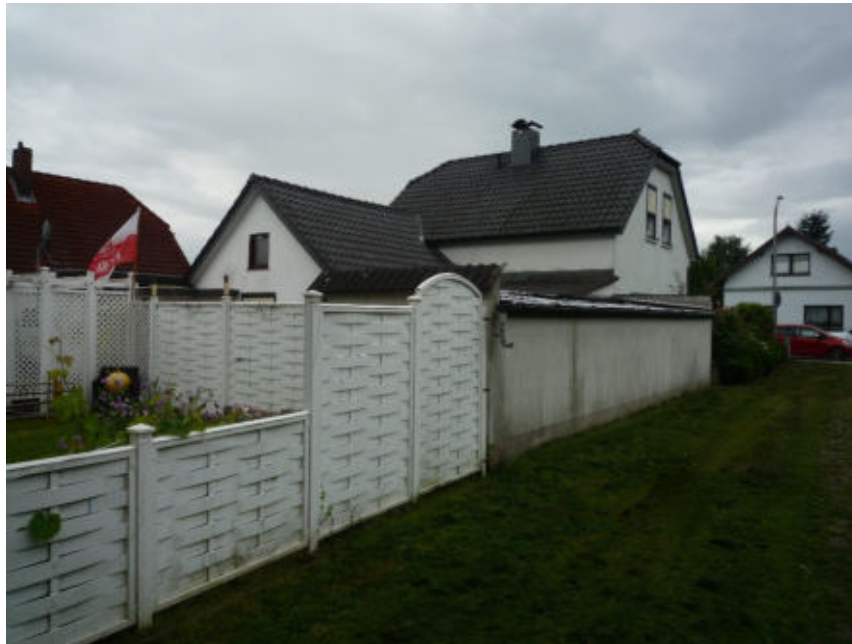
Wohnhaus mit Anbauten, Nordwestansicht