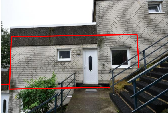
Ansicht des Bewertungsobjekts aus südlicher Richtung