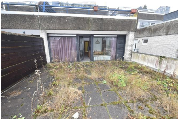
Blick vom Ende der Dachterrasse Richtung Wohnzimmer