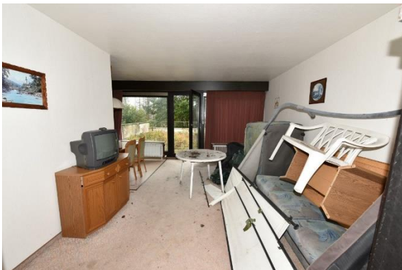
Wohn- u. Esszimmer mit Küchenbereich