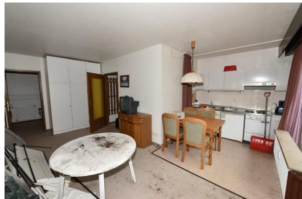
Wohn- u. Esszimmer mit Küchenbereich