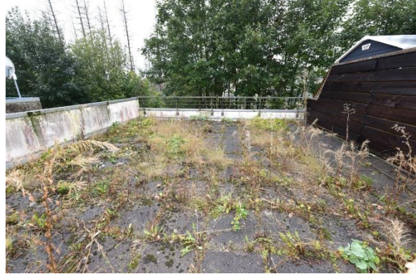
Blick über die Dachterrasse