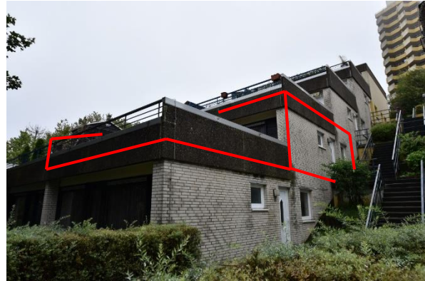
Blick durch die Wohnanlage aus südwestlicher Richtung