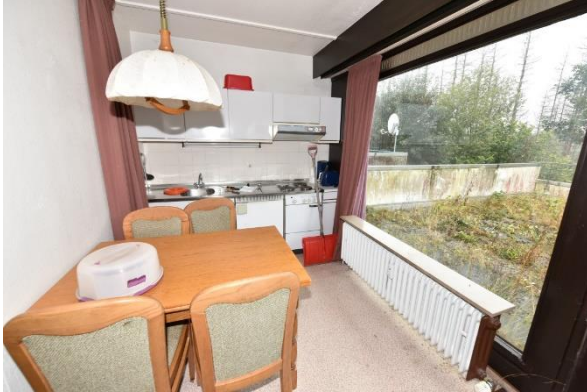
Küchen- und Essbereich