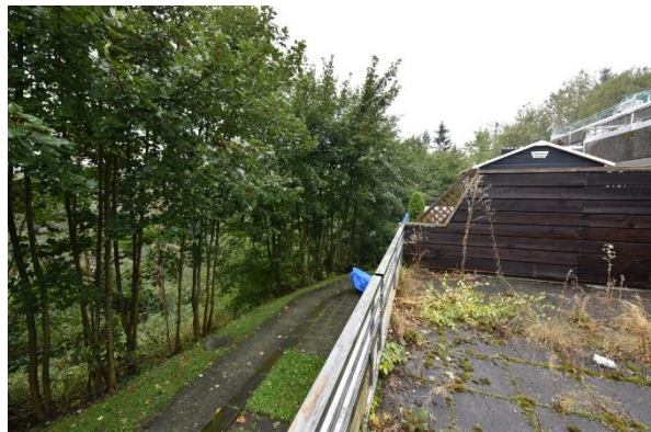
Blick von der Dachterrasse in nordwestliche Richtung