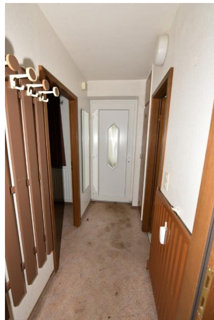
Flur (in Richtung Wohnungseingang)