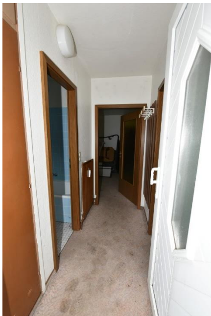
Flur (in Richtung Wohnzimmer)