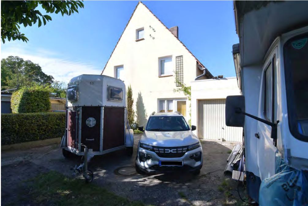
Wohngebäude von Süden