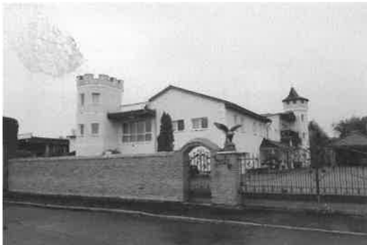
straßenseitige/ zufahrtsseitige Ansicht