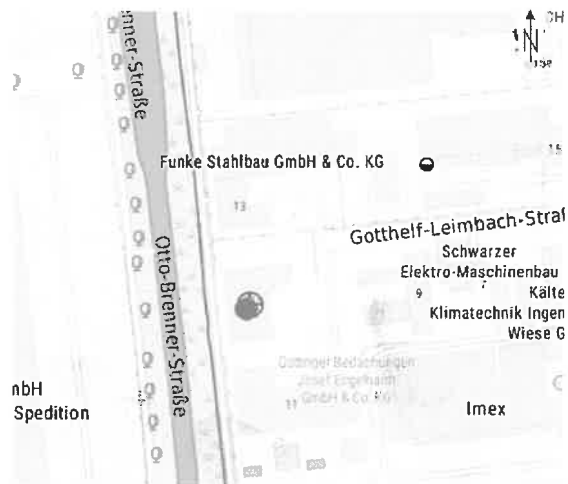
Lage im Industriegebiet